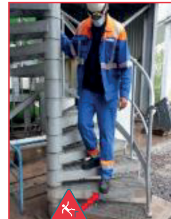
Étroitesse de l'escalier côté central