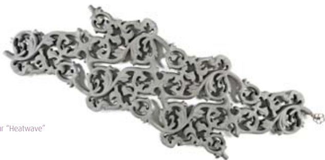
JAGA Radiateur "Heatwave"