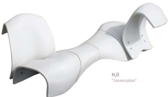
H 2 O "Conversation"