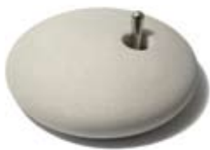
REALITEM Interrupteur "Elo"