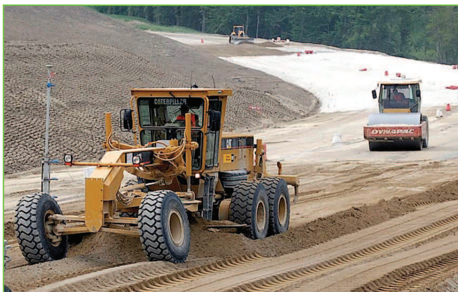
Réglage à la niveleuse, avant le passage du premier compacteur.

La qualité du compactage et les objectifs de densification (taux de compactage) ont été vérifiés sur la