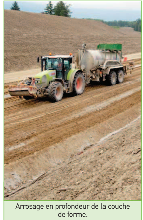
Arrosage en profondeur de la couche de forme.

Géotechnique chez DTP Terrassement. Plusieurs liants hydrauliques routiers, à base clinker et à base laitier, ont été testés afin de déterminer les classes mécaniques pouvant potentiellement être atteintes et permettre ainsi de définir la stratégie de structure des plates-formes supports de chaussée. "La définition du couple PST (Partie Supérieure des Terrassements) / Couche de forme (performances mécaniques, épaisseur et résistance au gel) a conduit au choix d'une plate-forme de type PF3, c'est-à-dire AR2 + 35 cm de couche de forme de classe mécanique 5 en matériaux fins traités, criblés, pour donner un matériau 0/40 avec 50 % de particules inférieures à 80 microns" précise Emmanuel Lavallée. "Compte tenu du choix de traitement en place, la zone mécanique 4 a été visée en étude pour prise en compte du déclassé catalogue Zone 4 en Classe 5, selon le GTS ("Guide technique du traitement des sols à la chaux et aux liants hydrauliques routiers pour l'application et la réalisation des remblais et des couches de forme" édité par SETRA/LCPC). Cependant, les résistances en place ont été similaires à la zone mécanique de l'étude, du fait de l'évolution et des performances fiables des matériels de traitement et des procédures de contrôle, ce qui a justifié