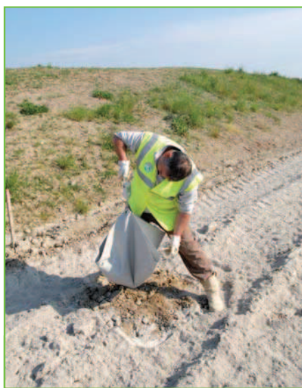
Un technicien vérifie par pesée le dosage exact en liant hydraulique routier (essai dit "à la bêche").