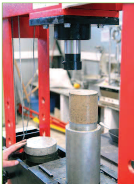
Éprouvette après façonnage.