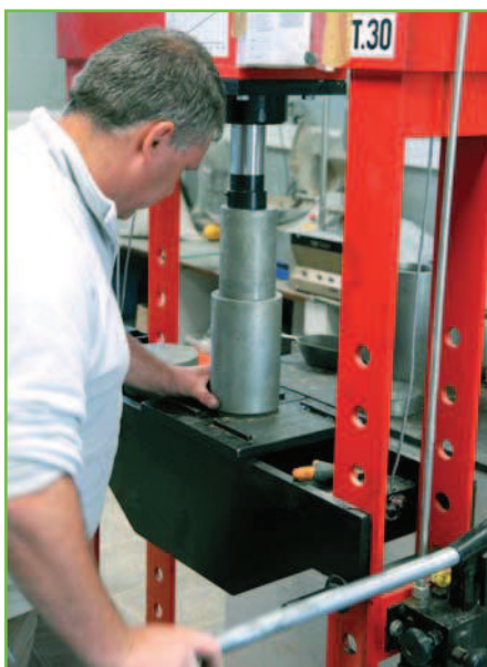
Réalisation d'éprouvette en laboratoire.