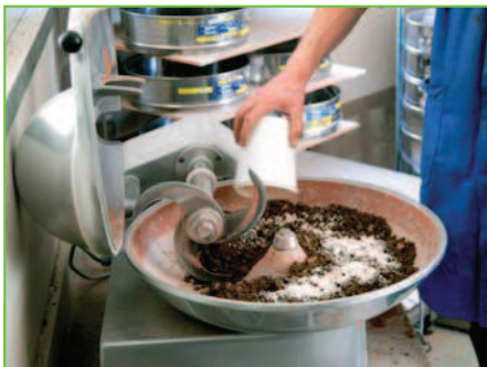
Malaxage en laboratoire du mélange matériau / liant / eau.

R elier Annecy à Genève en moins d'une demi-heure de route et avoir un accès rapide par Bellegarde à la ligne TGV Paris - Dijon en passant par le Haut-Bugey : c'est ce que permet désormais le tronçon A 41 Nord : St-Julien-en-Genevois / Villy-le-Pelloux ~ St-Martin-Bellevue. Ce tronçon vient, en effet, achever un axe autoroutier régional majeur qui,