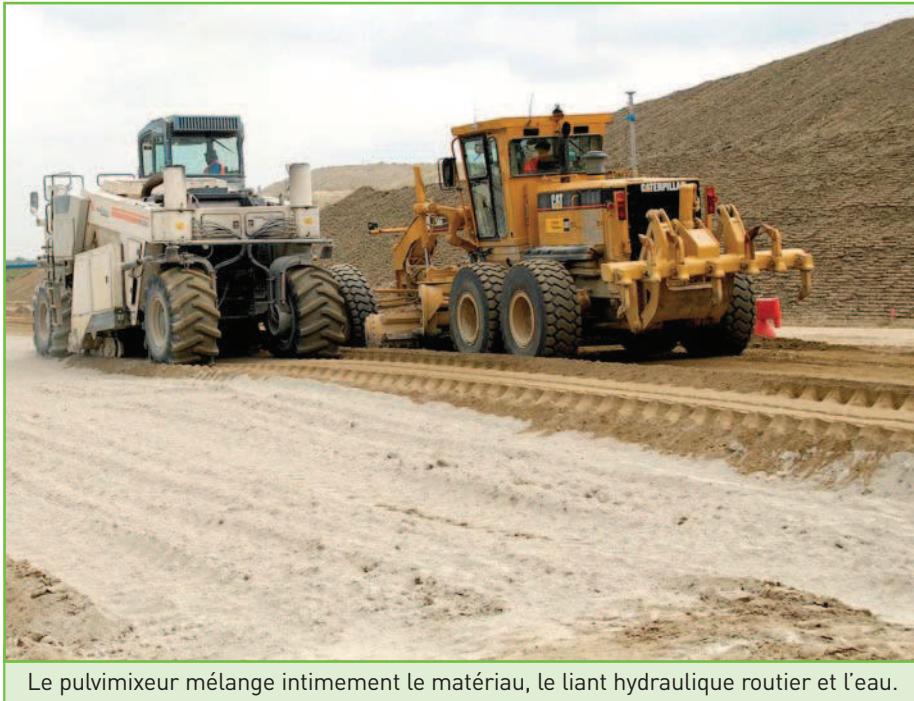
Le pulvimixeur mélange intimement le matériau, le liant hydraulique routier et l'eau.