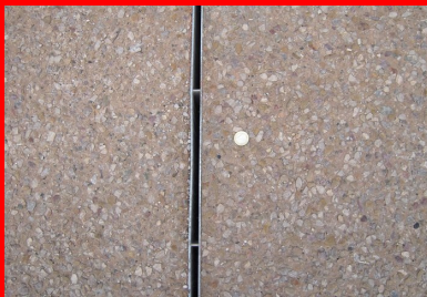
Détail du caniveau à fente.

final s'harmonise avec la couleur naturelle de la pierre utilisée dans la construction des façades et des bâtis qui longent l'aménagement.