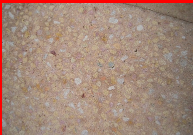
Rue de la République : aire de stationnement en béton bouchardé.

Nous attendons avec impatience la deuxième phase du projet d'aménagement, prévue en 2018.