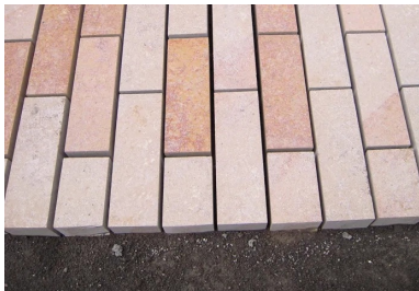
Le Buxy est une roche sédimentaire compacte. C'est un calcaire à grains fins et serrés et à petits cristaux de calcite, de couleur jaune-roux. Cette pierre naturelle peut présenter des taches ovalées et des zones flammées ou veinées de couleur lie-de-vin à mauve ou grise. Le Buxy est une pierre très dure, apte au grand trafic. Cette pierre peut être flammée pour obtenir une surface rugueuse antidérapante. Le Buxy est une pierre non gélive.