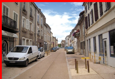
Rue de la République après aménagement.

À 9 km à l'ouest de Chalon-sur-Saône, en Bourgogne du Sud, Givry, porte de la côte chalonnaise, est connue pour ses domaines viticoles (AOC reconnue en 1946), son dynamisme socioculturel et ses nombreux monuments classés ou inscrits. Commune rurale, chef-lieu de canton du département de Saône-et-Loire, adhérente à la communauté d'agglomération du Grand Chalon, Givry compte aujourd'hui environ 3 950 habitants. D'origine gallo-romaine, Givry devient village fortifié au Moyen Âge, protégé à l'époque par des remparts s'ouvrant aux quatre points cardinaux. Au XVIII e siècle, Givry connaît une forte expansion grâce aux ressources que sont la forêt, le blé, la vigne... Les échevins décident de reconstruire l'hôtel de ville, ou porte de l'Horloge, à l'emplacement même de la porte Est. Émiland Gauthey et Thomas Dumorey en sont les architectes. C'est aujourd'hui un monument classé au titre des Monuments historiques, tout comme l'église Saint-Pierre-et-Saint-Paul, due, elle aussi, à Émiland Gauthey. Au fil du temps se sont ajoutés, au répertoire du patrimoine des Monuments historiques, d'autres édifices classés ou inscrits : Halle ronde, cellier aux Moines, croix, fontaines et lavoirs.