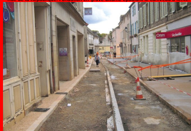
Rue de la République. Mise en œuvre manuelle du béton sur les trottoirs. Tiré à la règle sans vibration. le béton doit présenter une consistance