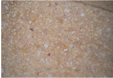
Rue de la République : aire de stationnement en béton bouchardé.

Nous attendons avec impatience la deuxième phase du projet d'aménagement, prévue en 2018.