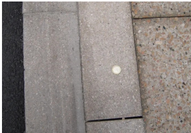
Route de Beaune : trottoir en béton désactivé et bordure en béton flammé.