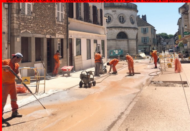
Rue de la République, Voirie en béton désactivé teinté : lavage du béton au jet d'eau à haute pression.

Le choix du béton s'est imposé : il s'agissait d'une volonté conjointe de la maîtrise d'ouvrage et de la maîtrise d'œuvre. Le centre-ville devant être essentiellement réservé aux piétons, il ne pouvait pas avoir un aspect routier, ce qui excluait les enrobés noirs. Esthétiquement, il fallait un revêtement de couleur claire, lequel a l'avantage de ne pas accumuler la chaleur, ce qui est intéressant du point de vue environnemental. Cela orientait le choix vers un revêtement en pavé local dit « pavé de Buxy » ou vers un béton décoratif. Mais l'entretien de l'espace urbain a guidé le choix vers un revêtement résistant, sans nécessiter la reprise régulière de joints. Finalement, le choix s'est porté sur un béton décoratif (associé ponctuellement avec des pavés de Buxy), les joints des pavés ne supportant pas l'action énergétique d'une machine de nettoyage à haute pression.