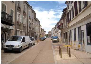
Rue de la République après aménagement.

À 9 km à l'ouest de Chalon-sur-Saône, en Bourgogne du Sud, Givry, porte de la côte chalonnaise, est connue pour ses domaines viticoles (AOC reconnue en 1946), son dynamisme socioculturel et ses nombreux monuments classés ou inscrits. Commune rurale, chef-lieu de canton du département de Saône-et-Loire, adhérente à la communauté d'agglomération du Grand Chalon, Givry compte aujourd'hui environ 3 950 habitants. D'origine gallo-romaine, Givry devient village fortifié au Moyen Âge, protégé à l'époque par des remparts s'ouvrant aux quatre points cardinaux. Au XVIII e siècle, Givry connaît une forte expansion grâce aux ressources que sont la forêt, le blé, la vigne... Les échevins décident de reconstruire l'hôtel de ville, ou porte de l'Horloge, à l'emplacement même de la porte Est. Émiland Gauthey et Thomas Dumorey en sont les architectes. C'est aujourd'hui un monument classé au titre des Monuments historiques, tout comme l'église Saint-Pierre-et-Saint-Paul, due, elle aussi, à Émiland Gauthey. Au fil du temps se sont ajoutés, au répertoire du patrimoine des Monuments historiques, d'autres édifices classés ou inscrits : Halle ronde, cellier aux Moines, croix, fontaines et lavoirs.