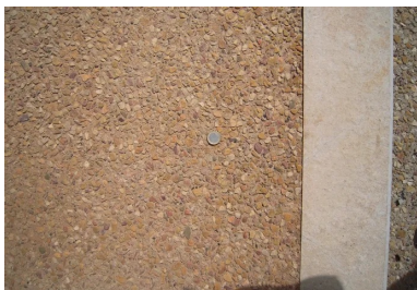
Rue de la République : voirie en béton désactivé teinté.

En fonction de la zone visée, le traitement de surface est soit la désactivation, soit le bouchardage.