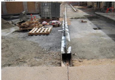
Rue de la République. Fondation en grave-bitume épaulant le caniveau à fente.