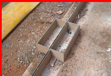
Rue de la République. Mise en place du caniveau à fente sur la plate-forme support.