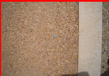
Rue de la République : voirie en béton désactivé teinté.

En fonction de la zone visée, le traitement de surface est soit la désactivation, soit le bouchardage.