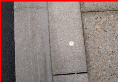
Route de Beaune : trottoir en béton désactivé et bordure en béton flammé.