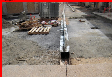
Rue de la République. Fondation en grave-talume épaulant le caniveau à fente.