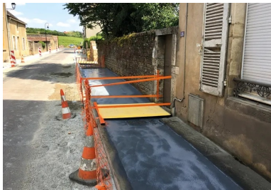
Rue de Beaune. Trottoirs en béton désactivé. À noter les passerelles pour assurer l'accessibilité et la protection du chantier.