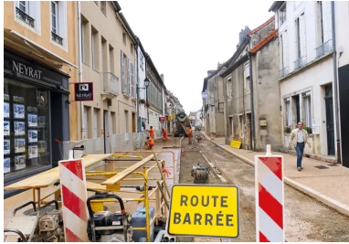
Rue de la République. Aménagement par tranches pour minimiser la gêne aux riverains. Nécessité de travailler par petites zones, en alternant les travaux de part et d'autre de la rue. Protection des façades à l'aide de feuilles en plastique.