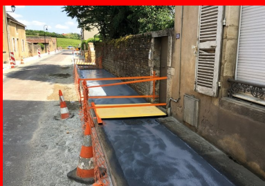
Rue de Beaune, Trottoirs en béton désactivé. A noter les passerelles pour assurer l'accessibilité et la protection du chantier.