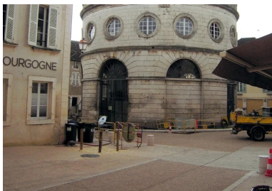
La Halle ronde au croisement de la rue de la République et de la rue de l'Hôtel-de-Ville.

L'aménagement du centre-bourg de Givry est un projet de grande ampleur. Il sera réalisé en trois phases et durera trois années (de 2017 à 2019). Le chantier actuel en est la première phase et concerne l'hypercentre, principalement la rue de la République et la route de Beaune. En 2018, les travaux seront reconduits sur la place de la Poste, le parc Georges-Laporte et la place de l'Église, en utilisant les mêmes produits et techniques. La dernière phase aura lieu en 2019 et concernera la place d'Armes.