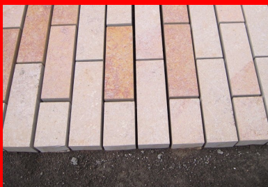
Le Buxy est une roche sédimentaire compacte. C'est un calcaire à grains fins et serrés et à petits cristaux de calcite, de couleur jaune-roux. Cette pierre naturelle peut présenter des taches ovales et des zones flammées ou veinées de couleur lie-de-vin à mauve ou grise. Le Buxy est une pierre très dure, apte au grand trafic. Cette pierre peut être flammée pour obtenir une surface rugueuse antidérapante. Le Buxy est une pierre non gélive.