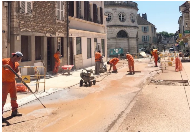
Rue de la République. Voirie en béton désactivé teinté : lavage du béton au jet d'eau à haute pression.

Le choix du béton s'est imposé : il s'agissait d'une volonté conjointe de la maîtrise d'ouvrage et de la maîtrise d'œuvre. Le centre-ville devant être essentiellement réservé aux piétons, il ne pouvait pas avoir un aspect routier, ce qui excluait les enrobés noirs. Esthétiquement, il fallait un revêtement de couleur claire, lequel a l'avantage de ne pas accumuler la chaleur, ce qui est intéressant du point de vue environnemental. Cela orientait le choix vers un revêtement en pavé local dit « pavé de Buxy » ou vers un béton décoratif. Mais l'entretien de l'espace urbain a guidé le choix vers un revêtement résistant, sans nécessiter la reprise régulière de joints. Finalement, le choix s'est porté sur un béton décoratif (associé ponctuellement avec des pavés de Buxy), les joints des pavés ne supportant pas l'action énergétique d'une machine de nettoyage à haute pression.