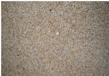
Rue de la République : trottoir en béton désactivé teinté.