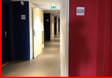
Maison de la Corée