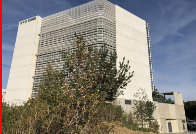
Maison de la Corée