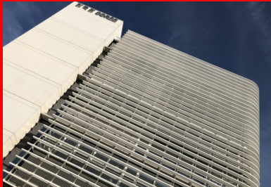
Maison de la Corée