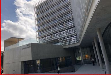
Maison de la Corée