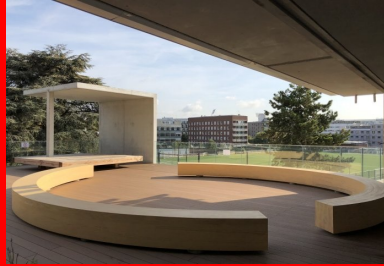
Maison de la Corée