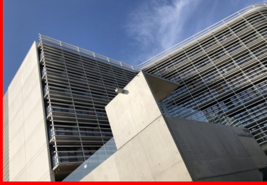
Maison de la Corée

Ministère coréen de l'Éducation a été désigné pour réaliser ce bâtiment avec le soutien de la Fondation coréenne pour la promotion de l'enseignement. Un appel d'offre a été lancé en 2015 à l'issu duquel une équipe d'architectes franco-coréenne Ga.a architects et Canale 3 a été désignée pour réaliser la Maison de la Corée .