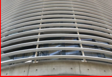
Maison de la Corée