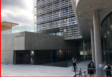
Maison de la Corée