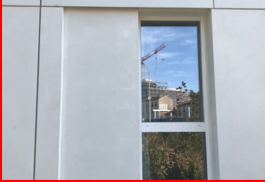
Maison de la Corée