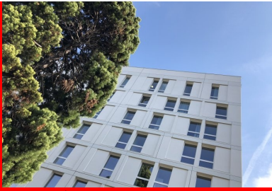
Maison de la Corée