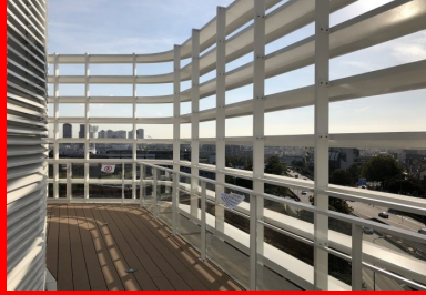
Maison de la Corée