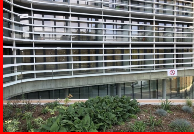
Maison de la Corée