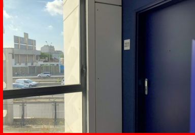
Maison de la Corée

Pierre Boudon, architecte (Canale 3) , explique la genèse du projet, ses inspirations communes avec l'agence coréenne Moon Choi+ga.a , les contraintes techniques (proximité du périphérique, sous-sol..) et les options prises pour réaliser ce bâtiment