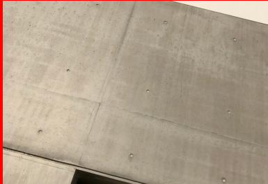
Maison de la Corée