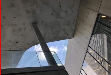
Maison de la Corée