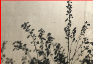
Maison de la Corée