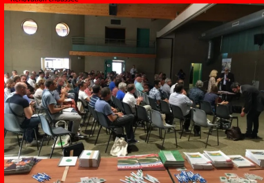
Journée technique LHR