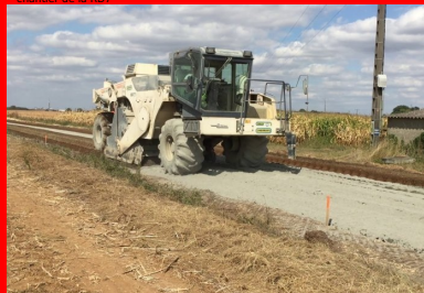
chantier de la RD7