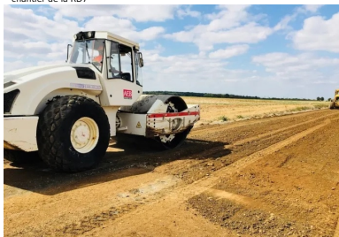
chantier de la RD7

Les journées techniques "Valorisation des matériaux en place aux liants hydrauliques" s'adressent à tous les acteurs concernés par la construction et l'entretien des routes : les élus et leurs services techniques, les bureaux d'études et tous les professionnels de la route.