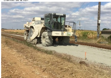
chantier de la RD7