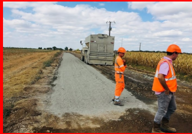
chantier de la RD7