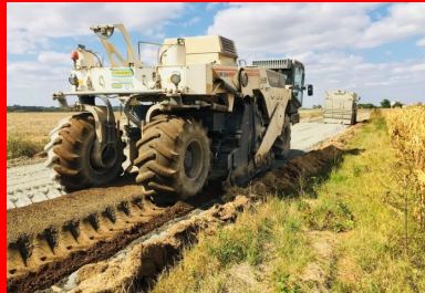
chantier de la RD7