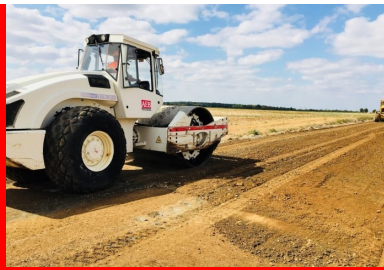
chantier de la RD7

Les journées techniques " Valorisation des matériaux en place aux liants hydrauliques" s'adressent à tous les acteurs concernés par la construction et l'entretien des routes : les élus et leurs services techniques, les bureaux d'études et tous les professionnels de la route.