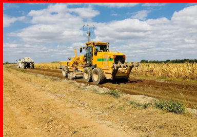
chantier de la RD7