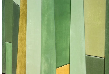
Gros plan sur le revêtement en « peau de sirène » des parements de béton.