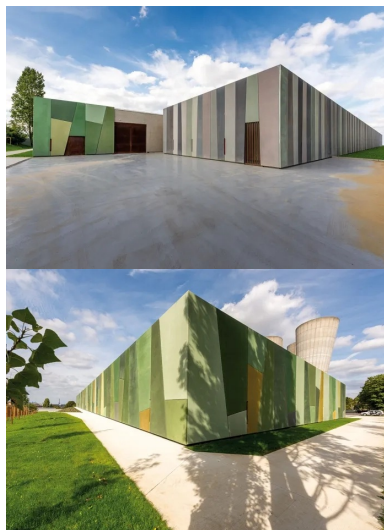
Angle nord-est du réservoir, quelques-uns des 356 panneaux de béton déclinés en 23 teintes.

Ce nouveau réservoir, le plus important du SEDIF, est entièrement construit avec un béton capable de résister à la fois aux fortes poussées provoquées par les 50 000 m 3 d'eau qu'il contient, aux corrosions des agents chimiques et au chlore utilisés pour potabiliser l'eau. Le béton a été coulé en voiles de 75 cm d'épaisseur et 12 m de hauteur, dont 6 m seulement apparents. En raison des longueurs de façades très importantes, plus de 100 m, les équipes de Bouygues TP ont mis en place des joints de dilatation de 2 cm, de type waterstop. Sur la face interne, afin d'amortir les efforts de poussées sur les parois, les angles des réservoirs sont arrondis, coulés en place grâce à un outil coffrant cintrable. Quant au radier, fractionné en huit plots de 400 à 800 m 3 de béton, réalisés en coulage continu, il a été dimensionné afin de résister aux poids des voiles béton de 12 m de hauteur, et aux efforts particuliers générés par la poussée de l'eau. Ainsi, l'épaisseur du béton du radier varie, passant de 70 cm sur les 20 m centraux, à 1 m d'épaisseur sur les 3 m périphériques.