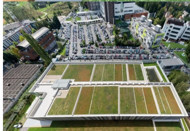
La toiture-terrasse, végétalisée en damiers, et qui reprend les coloris des bétons de façades.

Maître d'ouvrage : SEDIF - Maître d'œuvre : groupement : Lelli Architectes, Dominique et Giovanni Lelli ; Artelia ; BG Ingénieur-conseil - BET : BG, Artelia, Bton Design - Fournisseurs bétons : Holcim pour la structure, Lafarge pour le Ductal - Entreprise de préfabrication : Edycem Naullet - Conception des plaques scintillantes : Bton Design - Protection : Grace Pieri ; Graffistop et Hydroxi - Entreprises : Bouygues TP ; Sogea ; CSM Bessac ; Soletanche Bachy - Surface : 5 600 m 2 - Coût : 36 M€ HT - Chantier : 2012-2015.