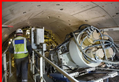
Pour améliorer le calendrier général du projet, deux tunneliers creusent simultanément des portions différentes du tunnel principal long de 5,8 km.

Le tronçon nord est réalisé par Bouygues Travaux Publics/Soletanche Bachy France/ Soletanche Bachy tunnel/CSM Bessac. « Solenne », le tunnelier de ce groupement, fabriqué par NFM Technologies, doit réaliser 1 719 m de tunnel entre la future station Clichy Saint-Ouen RER et la rue Marcel Cachin, à Saint-Denis. Assemblé au fond de la « boîte » de l'ouvrage annexe place du Capitaine Glarner, à une trentaine de mètres sous la surface du terrain naturel, il a démarré son creusement en 2016 en direction de Mairie de Saint-Ouen. C'est aussi lui qui réalisera sur 501 m le raccordement souterrain au Site de Maintenance et de Remisage (SMR) des rames, seule une courte portion, dans le quartier des Docks de Saint-Ouen, étant effectuée en tranchée couverte depuis la surface. Enfin, « Solenne » reviendra à son point de départ et sera retourné pour creuser le tronçon rejoignant la station Clichy Saint-Ouen. Les deux tunneliers fonctionnent 24 heures sur 24, de cinq à sept jours par semaine, à raison de 12 m d'avancement moyen au quotidien, soit une cadence d'environ 250 m par mois. Chaque chantier occupe environ 70 techniciens répartis en trois postes.