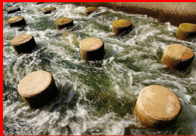
Les 113 cylindres de béton cassent la dynamique de l'eau et permettent aux poissons de se reposer lorsqu'ils remontent le courant.

Lors de l'édition 2014 du Prix Infrastructures – Mobilité – Biodiversité (IMB), 23 projets et initiatives ont concouru. La création de la passe à poissons dans le lit du Vidourle a été récompensée par le 1er prix dans la catégorie « génie écologique » décerné à la Direction Régionale Languedoc-Roussillon de RFF (SNCF Réseau) et l'Agence de l'eau. Le Prix IMB est organisé depuis 2010 par l'Institut des Routes, des Rues et des Infrastructures pour la Mobilité (IDRRIM). Il récompense chaque année les meilleures initiatives prises par les acteurs impliqués dans la conception, la construction, la gestion, l'entretien, l'aménagement, la requalification et l'exploitation des infrastructures de mobilité en faveur de la préservation, de la restauration et de la valorisation des écosystèmes et de la biodiversité.