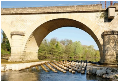
Un suivi environnemental a été assuré pendant toute la durée des travaux qui ont eu lieu de mai à septembre 2014.

Leur objectif ? Casser la dynamique de l'eau et permettre ainsi aux poissons de s'abriter pour se reposer lorsqu'ils remontent la rivière. Ces « menhirs » ont été coulés en place et encastrés dans une dalle en béton armé, ce qui leur laisse une hauteur utile de 50 cm. Une seconde phase a consisté à mettre en place des enrochements secondaires disposés entre les menhirs de façon aléatoire et scellés dans un bain de mortier d'une vingtaine de centimètres d'épaisseur. Pour ne pas déstabiliser le radier en maçonnerie, structurel vis-à-vis des piles de l'ouvrage existant, sa démolition a été réalisée par plots.