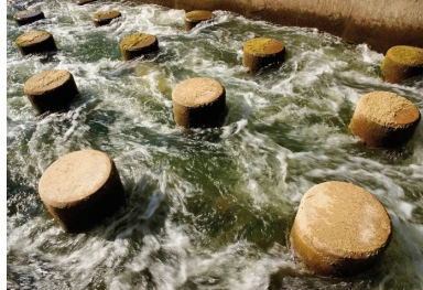
Les 113 cylindres de béton cassent la dynamique de l'eau et permettent aux poissons de se reposer lorsqu'ils remontent le courant.

Lors de l'édition 2014 du Prix Infrastructures - Mobilité - Biodiversité (IMB), 23 projets et initiatives ont concouru. La création de la passe à poissons dans le lit du Vidourle a été récompensée par le 1er prix dans la catégorie « génie écologique » décerné à la Direction Régionale Languedoc-Roussillon de RFF (SNCF Réseau) et l'Agence de l'eau. Le Prix IMB est organisé depuis 2010 par l'institut des Routes, des Rues et des Infrastructures pour la Mobilité (IDRRIM). Il récompense chaque année les meilleures initiatives prises par les acteurs impliqués dans la conception, la construction, la gestion, l'entretien, l'aménagement, la requalification et l'exploitation des infrastructures de mobilité en faveur de la préservation, de la restauration et de la valorisation des écosystèmes et de la biodiversité.