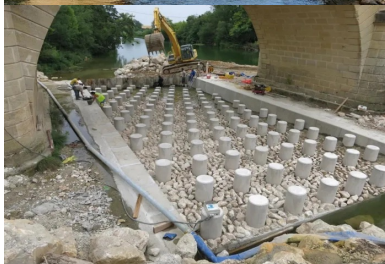
Les « menhirs » de 50 cm de diamètre et hauts de 90 cm, laissant une hauteur utile de 50 cm, sont ancrés dans un radier en béton armé. au-dessus, des enrochements secondaires disposés de façon aléatoire ont été scellés dans un bain de mortier.