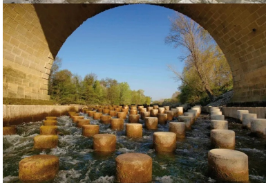
Les 113 cylindres de béton cassent la dynamique de l'eau et permettent aux poissons de se reposer lorsqu'ils remontent le courant.