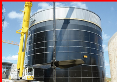
Phase de levage d'un agitateur pendulaire...