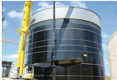
Phase de levage d'un agitateur pendulaire...

« Rentabiliser la méthanisation à cette échelle industrielle est un cas concret d'économie circulaire où ces déchets nés de l'activité humaine sont régénérés pour retourner à la terre et l'enrichir, explique Aymeric Minot, responsable Développement chez Eneria. Le procédé est avantageux pour les économies locales puisque les collectivités tirent bénéfice d'une création d'emplois non délocalisables : ici, 16 personnes embauchées à plein temps pour le transport des « marchandises » et l'exploitation de l'unité. Dans le même temps, le système favorise l'autonomie énergétique territoriale en participant à la production locale d'énergie renouvelable. Les atouts environnementaux sont également multiples puisque l'unité de méthanisation offre une solution efficace pour gérer collectivement les effluents, préserver les sols, améliorer le bilan carbone et diminuer la production de gaz à effet de serre . Si la concentration des déchets peut paraître une mauvaise nouvelle pour le voisinage, nous avons porté tous nos efforts sur la gestion des nuisances olfactives... qui sont, quoi qu'il en soit, sans commune mesure avec l'odeur des épandages. »