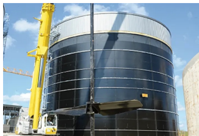
Phase de levage d'un agitateur pendulaire...