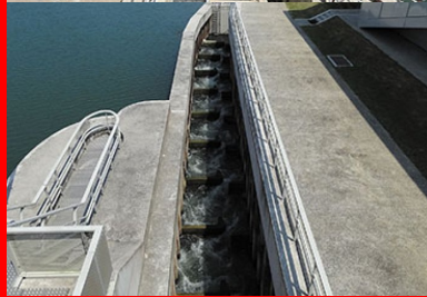
Passes à poissons à chambres successives dans les barrages de Vives-Eaux et Chatou.