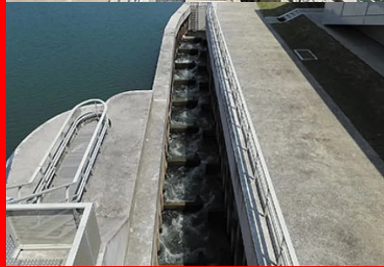
Passes à poissons à chambres successives dans les barrages de vives-eaux et Chatou.