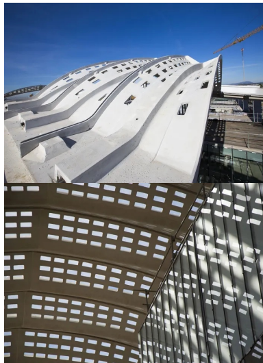
Au centre des palmes, les câbles de précontrainte passent dans une cage d'armatures pour reprendre les efforts en torsion.

BFUP : 750 m 3 , 115 palmes, 480 coques, 150 éléments de casquette