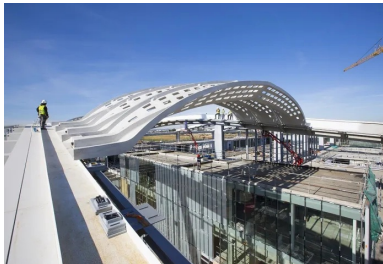
Les palmes sont réparties en cinq travées de 23 unités.