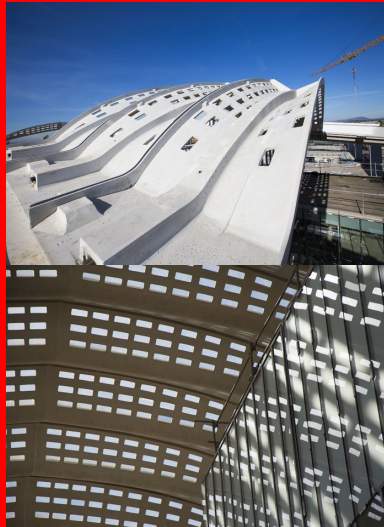
Au centre des palmes, les câbles de précontrainte passent dans une cage d'armatures pour reprendre les efforts en torsion.

BFUP : 750 m 3 , 115 palmes, 480 coques, 150 éléments de casquette