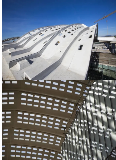
Au centre des palmes, les câbles de précontrainte passent dans une cage d'armatures pour reprendre les efforts en torsion.

BFUP : 750 m 3 , 115 palmes, 480 coques, 150 éléments de casquette