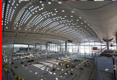
En sous-face, les coques habitent la structure et forment avec les palmes une surface à double courbure.