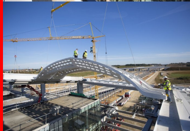
Elles sont mises en place avec une grue de 1 200 t et de 100 m de flèche.