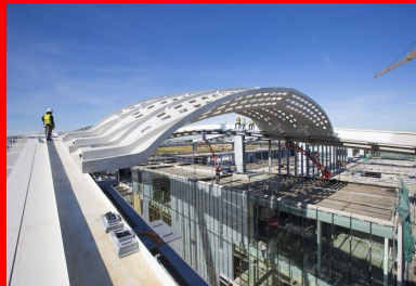
Les palmes sont réparties en cinq travées de 23 unités.