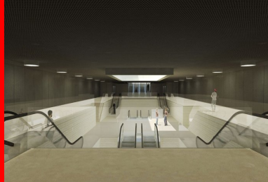
Pour évoquer l'ambiance d'un gouffre, l'intérieur de la gare de Bagneux sera traité avec un béton clair.

Illustrations 3D : © Atelier d'architecture King Kong; Atelier Barani ; Valode & Pistre (ARCHI GRAPHI)