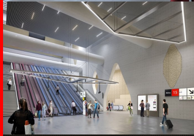
La structure massive des voiles de béton perforés s'évide en s'élevant.