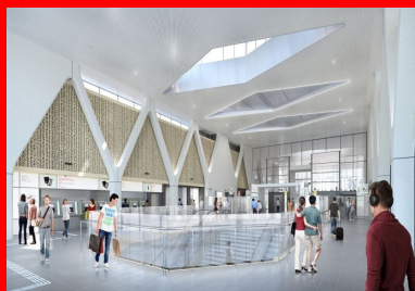
La structure biomorphe de la gare des Ardoines conçue par Valode et Pistre s'apparente à un squelette.

33 km 16 gares 38 ouvrages annexes 22 communes 4 départements : 92, 94, 93, 77 250 000 à 300 000 voyageurs/jour (en semaine) à la mise en service