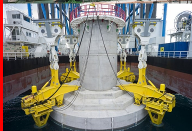
Les embases de 4 500 t sont posées avec une précision de 35 mm grâce à la barge zourite.