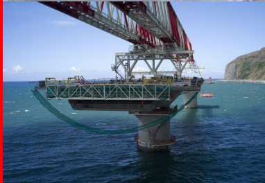
Appuyée sur les piles déjà en place, la poutre de lancement géante est capable d'assembler un fléau complet avant de se déplacer vers sa position suivante.