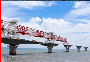
Appuyée sur les piles déjà en place, la poutre de lancement géante est capable d'assembler un fléau complet avant de se déplacer vers sa position suivante.