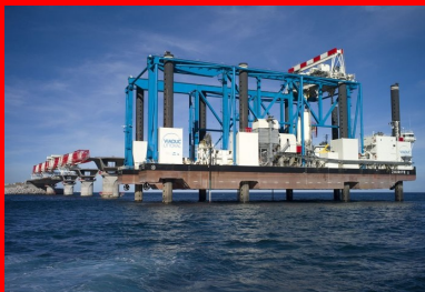
Zourite, la plate-forme automotrice, peut se stabiliser en se hissant sur ses 8 jambes d'acier. Les éléments de piles peuvent alors être installés dans des conditions équivalentes à celles de la terre ferme.

Viaduc : longueur 5 409 m, largeur 29,80 m, élévation de 20 à 30 m au-dessus de la mer 1 386 voussoirs préfabriqués : formant 7 tabliers successifs de 770 m 48 piles en mer 9 300 tonnes de précontrainte 300 000 m 3 de béton de structure Une mégabarge autoélévatrice : de 4 800 t de capacité