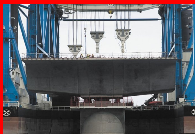
La barge zourite permet de transporter en une fois la tête de pile surmontée du mégavoussoir sur pile.

Une fois la phase de maturation des piles et des voussoirs terminée, ces éléments structurels sont pris en charge pour être acheminés jusqu'à leur lieu de pose. Leurs destins se séparent alors. Les piles sont embarquées directement depuis le quai de l'aire de préfabrication sur une barge géante baptisée Zourite, spécialement fabriquée pour le chantier et disposant d'une capacité de 4 800 t (voir encadré). Pour chaque pile, Zourite effectue deux voyages aux chargements optimisés : un premier pour le transport et la pose de l'embase (jusqu'à 4 800 t), le second pour le transport et la pose de la tête de pile et du mégavoussoir sur pile (d'un poids cumulé atteignant également la capacité maximale de la barge, soit 4 800 t).