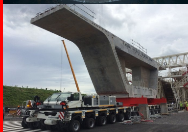
Les voussoirs sont acheminés depuis l'aire de stockage jusqu'à leur lieu de pose sur des fardiers munis de 216 roues !