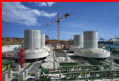
Les semelles de fondation cylindriques des embases de piles sont très massives : de 20 à 23 m de diamètre pour 4 m d'épaisseur.

Pour limiter le poids des colis à transporter en mer, elles sont préfabriquées en deux tronçons : l'embase, constituée de la semelle de fondation et de l'amorce du fût de pile, et la tête de pile, composée quant à elle de la partie supérieure du fût de pile et du chevêtre. Embases et têtes de piles disposent chacune de deux lignes de production sur l'aire de préfabrication. Au cours de leur fabrication, ces pièces massives, d'un poids maximum de 2 000 t pour les têtes de piles et 4 800 t pour les embases, vont être déplacées le long de la ligne de production selon 4 positions successives (3 pour les têtes de piles) constituant autant d'ateliers : préparation des cages d'armatures, bétonnage, finitions, stockage, puis chargement. Sur l'aire de fabrication sont également assemblés des colis spéciaux, les « méga-voussoirs sur pile », qui correspondent à l'amorce du tablier sur chaque pile. Ces pièces de 2 400 t sont constituées de l'assemblage de 7 voussoirs.