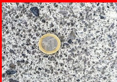
Les granulats (Courbaisse) proviennent de l'arrière-pays niçois.