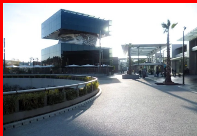
Les voies piétonnes et le parvis des magasins de Polygone Riviera ont été réalisés en béton micro-désactivé par la société MB Constructions.

L'aménagement paysager – où le béton décoratif forme un élément de valorisation et de prestige – constitue le lien entre les deux écritures architecturales. Chargé des aménagements extérieurs, le célèbre architecte-paysagiste Jean Mus – créateur de plus d'un millier de jardins dans le monde – a travaillé plusieurs années sur le projet. « Avec passion », précise-t-il. Son défi : transformer la vallée du Malvan – du nom de la rivière qui y coule – en petit paradis, en lieu de promenade et de shopping, agréable et accueillant. « Polygone Riviera, c'est un concentré de Méditerranée, conçu pour le plaisir des sens », résume-t-il.