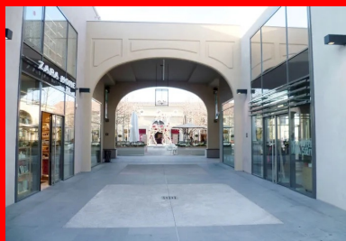
Au total, le béton micro-désactivé a été mis en œuvre sur une superficie de 1 702 m 2 .

Outre son concept audacieux et la richesse de son offre commerciale, l'autre grande réussite de Polygone Riviera réside dans la qualité de ses cheminements piétons. Un aménagement de première importance pour un projet qui prévoit d'accueillir à terme entre 8 et 10 millions de visiteurs par an ! Les espaces publics – facteurs attractifs majeurs du projet – proposent notamment un parcours artistique de dix œuvres. Pour respecter le principe du lieu de promenade, toutes les voies piétonnières ont fait l'objet d'un soin attentif : une partie de celles-ci a été réalisée en pierre de trois teintes de gris, dont le calepinage et le format de dalles varient selon les zones ; le restant a été confié à la société MB Constructions, sous-traitante du lot « revêtement », spécialisée dans le béton décoratif et implantée à Gattières, à quelques kilomètres du chantier.