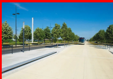
La voie dédiée au BHNS se distingue des voiries existantes par sa couleur claire.

Un chantier également très exigeant du point de vue technique ! Dès l'origine du projet, le maître d'ouvrage a en effet souhaité différencier la voie dédiée au BHNS des voiries existantes. « Nous avons voulu dissocier cette infrastructure en site propre de l'image classique d'une voirie en enrobé noir, notamment par un revêtement de couleur claire, précisait à l'époque Lauriane Blézel, ingénier en charge de cette opération à l'EPA-Sénart, maître d'ouvrage désigné par le Stif (cf. Routes n° 116). Et si nous avons très vite opté pour une chaussée en béton , c'est pour une triple raison : d'abord, ce matériau évite l'orniérage, notamment au niveau de l'accostage aux stations, un problème désormais bien connu des maîtrises d'ouvrage qui réalisent des TCSP. Ensuite, la durée de vie de ce type de chaussée réduit au minimum les restrictions de circulation de bus, liées aux travaux d'entretien du revêtement. Enfin, le béton permet un travail architectural très soigné, notre objectif étant que les usagers assimilent cette voie à une circulation en mode doux. Nous voulions en quelque sorte que la voirie traditionnelle mette en valeur le site propre, et non l'inverse. »