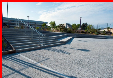
Les nez de marche et les contremarches des escaliers sont en béton hydrosablé

Dévalorisé, enclavé, mal desservi, Génicart était un quartier dit « sensible » de quelque 7 000 habitants, jeunes, en majorité locataires, pour la plupart en difficulté d'emploi ou à petits revenus. Pour améliorer les conditions de vie et remettre à niveau l'environnement dégradé, la municipalité a lancé un vaste plan de réaménagement : réhabilitation ou construction de logements, embellissement des espaces extérieurs, amélioration de la circulation avec la création d'une nouvelle rue, construction de plusieurs équipements publics d'envergure... Point d'orgue de ce processus : l'édification du pôle Brassens-Camus, vaste polygone en béton (y compris les cheminements intérieurs), à la façade de bois et de verre.