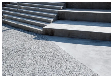
Pour les gradins, c'est le béton lisse qui a été choisi

« Nous avons aménagé des espaces distincts : à l'extérieur, deux parvis, des allées, des gradins devant une scène de hip-hop, des escaliers et des pas-d'âne, ainsi qu'une coursive à l'intérieur du bâtiment, explicite Eric Salle, conducteur des travaux chez Sols-Aquitaine. Pour cela, nous avons utilisé principalement une même formule constituée de deux agrégats de couleur différente, que nous avons déclinée en trois finitions : à l'extérieur, les parvis, allées et pas-d'âne sont désactivés ; les nez de marche et les contremarches des escaliers sont hydroabslés ; et l'intérieur de la coursive est bouchardé. Pour donner du rythme à ces espaces, des bandes structurantes de 10 cm, en béton gris , lient l'intérieur à l'extérieur. Elles permettent d'amener "l'œil" du parvis aux allées et jusqu'au skatepark en béton noir taloché fin, en passant par la scène de hip-hop et les gradins en béton lisse.