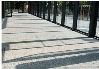
La coursière en béton bouchardé prolonge le parvis à l'intérieur du bâtiment.

« Le chantier a commencé en octobre 2013, mais nos interventions en béton décoratif se sont concentrées dans les quelques mois qui ont précédé la fin du chantier en mai 2016, note de son côté Dominique Noraz, chef de l'agence Sols-Aquitaine. Pour les finitions désactivées, hydrosablées et bouchardées, nous avons utilisé une formule de type C25/30 XF2 S3, avec un mélange de deux agrégats (50 % chacun) possédant la même granulométrie : le premier est un caillou à dominante gris bleuté (10/14C Gris des Pyrénées) et le second, plutôt vert, est une diorite de Thiviers (Périgord). Le ciment est celui de Lafarge Ciment, produit sur le site de La Couronne. Il est de type CEMIIA-LL 42,5R CP2. Cette formule a été fabriquée par Lafarge Béton à Lormont (soit à 3 km du chantier). En ce qui concerne les formules pour les bétons lisses, nous avons utilisé un béton normé de type C25/30 avec un dosage réel de ciment à 350 kg. Au total, nous avons mis en œuvre environ 500 m3 de béton décoratif : cela représente plus de 3 000 m2 d'aménagements sur un site qui est relativement contraint en termes de surface totale au sol, vu les équipements proposés, mais qui donne paradoxalement une réelle sensation d'espace... »