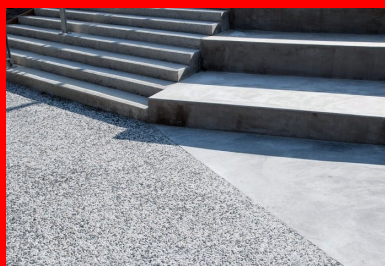
Pour les gradins, c'est le béton lisse qui a été choisi

« Nous avons aménagé des espaces distincts : à l'extérieur, deux parvis, des allées, des gradins devant une scène de hip-hop, des escaliers et des pas-d'âne, ainsi qu'une coursive à l'intérieur du bâtiment, explicite Eric Saille, conducteur des travaux chez Sols-Aquitaine. Pour cela, nous avons utilisé principalement une même formule constituée de deux agrégats de couleur différente, que nous avons déclinée en trois finitions : à l'extérieur, les parvis, allées et pas-d'âne sont désactivés ; les nez de marche et les contremarches des escaliers sont hydrosablés ; et l'intérieur de la coursive est bouchardé. Pour donner du rythme à ces espaces, des bandes structurantes de 10 cm, en béton gris , lient l'intérieur à l'extérieur. Elles permettent d'amener "l'œil" du parvis aux allées et jusqu'au skatepark en béton noir taloché fin, en passant par la scène de hip-hop et les gradins en béton lisse.