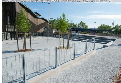
À l'extérieur, le béton désactivé valorise les parvis

Les parvis se situent sur deux niveaux et longent la façade du bâtiment. L'épaisseur du dallage est de 18 cm pour garantir un accès aux pompiers. Les allées PMR ont une épaisseur de 15 cm, tout comme les abords du