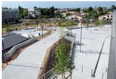
Vue depuis le pôle Brassens-Camus : une vaste « plaine de jeux » arborée s'ouvre sur le quartier Génicart, récemment réhabilité.

contraintes techniques de hauteur de marche pour un escalier et les pourcentages de pente adéquats pour les allées PMR », fait remarquer Eric Salle. Autre impondérable : la météo. « Elle a été défavorable, ce qui a généré beaucoup de retard ! » Enfin, l'ouverture au public de certaines zones du chantier, dès avant son achèvement, a compliqué le travail des équipes de Sols-Aquitaine, composées de cinq coéquipiers pour les bétons à plat et de deux, pour les escaliers et les gradins. « Tous les coulages ont été faits au dumper et directement par camion », précise encore le conducteur des travaux. Il en résulte, malgré les aléas, une superbe réalisation qui fait, à juste titre, la fierté des habitants du quartier Génicart. Une rénovation urbaine réussie, qui doit beaucoup au béton !