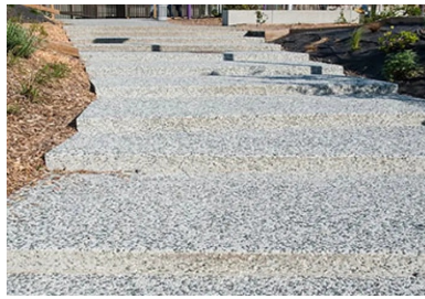
Réalisé en béton désactivé, le cheminement en pas-d'âne qui mène à l'entrée du pôle Brassens-Camus.

skatepark, détaille le conducteur des travaux chez Sols-Aquitaine. Nous avons également réalisé les dalles devant des bancs en béton gris avec une finition peluchée. Pour ce qui est de la scène de hip-hop et de ses gradins, nous avons travaillé sur un béton lisse, comme pour le skatepark. Quant à la coursière, c'est un prolongement du parvis qui rentre dans le bâtiment. »