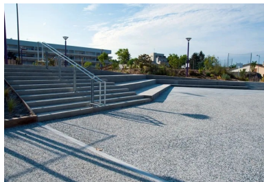
Les nez de marche et les contremarches des escaliers sont en béton hydroabslé

Dévalorisé, enclavé, mal desservi, Génicart était un quartier dit « sensible » de quelque 7 000 habitants, jeunes, en majorité locataires, pour la plupart en difficulté d'emploi ou à petits revenus. Pour améliorer les conditions de vie et remettre à niveau l'environnement dégradé, la municipalité a lancé un vaste plan de réaménagement : réhabilitation ou construction de logements, embellissement des espaces extérieurs, amélioration de la circulation avec la création d'une nouvelle rue, construction de plusieurs équipements publics d'envergure... Point d'orgue de ce processus : l'édification du pôle Brassens-Camus, vaste polygone en béton (y compris les cheminements intérieurs), à la façade de bois et de verre.