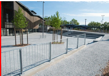
À l'extérieur, le béton désactivé valorise les parvis

Les parvis se situent sur deux niveaux et longent la façade du bâtiment. L'épaisseur du dallage est de 18 cm pour garantir un accès aux pompiers. Les allées PMR ont une épaisseur de 15 cm, tout comme les abords du skatepark, détaille le conducteur des travaux chez Sols-Aquitaine. Nous avons également réalisé les dalles devant des bancs en béton gris avec une finition peluchée. Pour ce qui est de la scène de hip-hop et de ses gradins, nous avons travaillé sur un béton lisse, comme pour le skatepark. Quant à la coursive, c'est un prolongement du parvis qui rentre dans le bâtiment. »