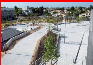
Vue depuis le pôle Brassens-Camus : une vaste « plaine de jeux » arborée s'ouvre sur le quartier Gécicart, récemment réhabilité.

contraintes techniques de hauteur de marche pour un escalier et les pourcentages de pente adéquats pour les allées PMR », fait remarquer Eric Salle. Autre impondérable : la météo. « Elle a été défavorable, ce qui a généré beaucoup de retard ! » Enfin, l'ouverture au public de certaines zones du chantier, dès avant son achèvement, a compliqué le travail des équipes de Sols-Aquitaine, composées de cinq coéquipiers pour les bétons à plat et de deux, pour les escaliers et les gradins. « Tous les coulages ont été faits au dumper et directement par camion », précise encore le conducteur des travaux. Il en résulte, malgré les aléas, une superbe réalisation qui fait, à juste titre, la fierté des habitants du quartier Gécicart. Une rénovation urbaine réussie, qui doit beaucoup au béton !