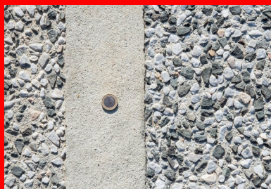
le béton désactivé (à droite du gros plan) intègre deux granulats : un 10/14AC Gris des Pyrénées et une diorite de Thiviers (Périgord)