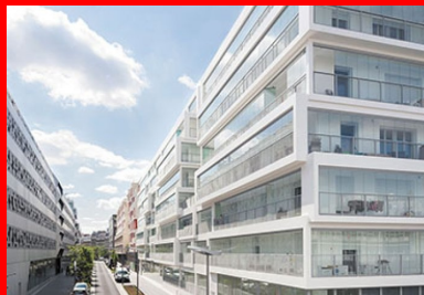
Un empilement de boîtes en béton qui doit sa légèreté aux façades entièrement vitrées.

Le bâtiment se livre à son environnement comme un empilement de boîtes vitrées légèrement décalées, de 10 à 60 cm, à la manière de grandes fenêtres sur la ville. Ce jeu de décalage crée une façade vibrante et dynamique dans laquelle se reflète le ciel suivant le point de vue adopté – une fragmentation qui individualise chaque logement et signale son échelle, les serres filant tout le long des logements. Bien plus qu'un simple dispositif formel signant une architecture, ces briques emboîtables, mi-béton, mi-verre, forment une peau épaisse qui enveloppe la construction pour offrir aux locataires un espace de vie supplémentaire, à la manière d'un jardin d'hiver dont les volets vitrés, pivotants et coulissants, peuvent s'escamoter à tout moment et venir se ranger contre le mur de séparation, transformant la serre en loggia classique. Appropriables tout au long de l'année, ils représentent entre 10 et 40 % d'espace supplémentaire suivant le type de l'appartement et sa position dans l'immeuble.