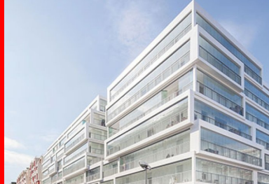
Seule exception au jeu de décalage, les loggias situées en pignon et faisant face au bâtiment mitoyen.

Le bâtiment se livre à son environnement comme un empilement de boîtes vitrées légèrement décalées, de 10 à 60 cm, à la manière de grandes fenêtres sur la ville. Ce jeu de décalage crée une façade vibrante et dynamique dans laquelle se reflète le ciel suivant le point de vue adopté – une fragmentation qui individualise chaque logement et signale son échelle, les serres filant tout le long des logements. Bien plus qu'un simple dispositif formel signant une architecture, ces briques emboîtables, mi-béton, mi-verre, forment une peau épaisse qui enveloppe la construction pour offrir aux locataires un espace de vie supplémentaire, à la manière d'un jardin d'hiver dont les volets vitrés, pivotants et coulissants, peuvent s'escamoter à tout moment et venir se ranger contre le mur de séparation, transformant la serre en loggia classique. Appropriables tout au long de l'année, ils représentent entre 10 et 40 % d'espace supplémentaire suivant le type de l'appartement et sa position dans l'immeuble.