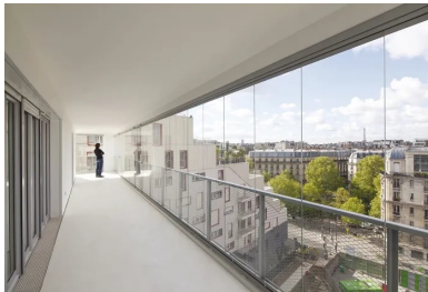
Au dernier étage, l'une des loggias offre une vue en cinémascope sur la ville.

Le contexte est assez particulier... Une parcelle sise entre le « vieux » Paris et un morceau de ville réinventé autour des voies SNCF, la Zac de Clichy-Batignolles, peuplée de nouvelles constructions aux architectures très variées. Elle comprend plusieurs secteurs dont celui dit de Saussure, à deux pas du Pont Cardinet, dans lequel se glisse l'immeuble dessiné par l'agence BVAU. Elle y inscrit un bâtiment à forte identité, facilement reconnaissable sans être ostentatoire pour autant. Le parti, ici, n'est pas de jouer sur la performance formelle, tant il est vrai que dans ce type de programme et de prospect, l'implantation et le volume global d'un bâtiment sont plus que cadrés. La marge de liberté de conception se joue sur l'organisation des logements, l'extension possible des cellules d'habitation sur l'extérieur, le rapport au voisinage et, plus largement, à la ville. C'est justement sur ces notions que l'agence BVAU a fondé l'originalité et la fonctionnalité de son projet.