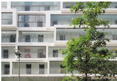
Les dimensions du cadre de chaque jardin d'hiver dévoilent la proportion de l'appartement qui s'y prolonge.

L'originalité et la qualité de ce bâtiment tiennent bien sûr à ces espaces « hybrides », mais également à l'organisation des différents logements qui profitent tous, a minima, de deux orientations, voire trois pour les plus spacieux. Les habitants disposent d'un appartement lumineux et fonctionnel, avec la possibilité de parcourir leur logement par l'extérieur, toutes les pièces de vie étant équipées de portes-fenêtres. Ils peuvent ainsi profiter pleinement d'un mode de vie alliant le dedans au dehors, où la frontière classique entre intérieur et extérieur prend une nouvelle dimension par l'ajout de cet espace tampon. À ce confort spatial, s'ajoute un confort acoustique . En effet, ces volets de verre ont, en outre, l'avantage de protéger. Ils forment un écran supplémentaire, un premier rempart vis-à-vis de l'environnement qui peut être bruyant. Cette première protection acoustique est relayée par la mise en place de menuiseries aux vitrages ultra-performants, notamment pour les façades situées près des voies de chemin de fer, en particulier le long de la rue Marie-Georges Picquart.