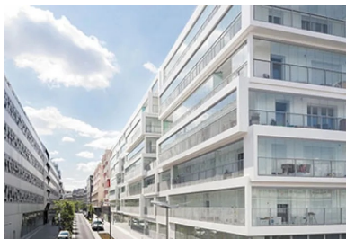
Un empilement de boîtes en béton qui doit sa légèreté aux façades entièrement vitrées.

Le bâtiment se livre à son environnement comme un empilement de boîtes vitrées légèrement décalées, de 10 à 60 cm, à la manière de grandes fenêtres sur la ville. Ce jeu de décalage crée une façade vibrante et dynamique dans laquelle se reflète le ciel suivant le point de vue adopté - une fragmentation qui individualise chaque logement et signale son échelle, les serres filant tout le long des logements. Bien plus qu'un simple dispositif formel signant une architecture, ces briques emboîtables, mi-béton, mi-verre, forment une peau épaisse qui enveloppe la construction pour offrir aux locataires un espace de vie supplémentaire, à la manière d'un jardin d'hiver dont les volets vitrés, pivotants et coulissants, peuvent s'escamoter à tout moment et venir se ranger contre le mur de séparation, transformant la serre en une loggia classique. Appropriables tout au long de l'année, ils représentent entre 10 et 40 % d'espace supplémentaire suivant le type de l'appartement et sa position dans l'immeuble.