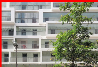
Les dimensions du cadre de chaque jardin d'hiver dévoilent la proportion de l'appartement qu'elle protège.

L'originalité et la qualité de ce bâtiment tiennent bien sûr à ces espaces « hybrides », mais également à l'organisation des différents logements qui profitent tous, a minima, de deux orientations, voire trois pour les plus spacieux. Les habitants disposent d'un appartement lumineux et fonctionnel, avec la possibilité de parcourir leur logement par l'extérieur, toutes les pièces de vie étant équipées de portes-fenêtres. Ils peuvent ainsi profiter pleinement d'un mode de vie alliant le dedans au dehors, où la frontière classique entre intérieur et extérieur prend une nouvelle dimension par l'ajout de cet espace tampon. À ce confort spatial, s'ajoute un confort acoustique . En effet, ces volets de verre ont, en outre, l'avantage de protéger. Ils forment un écran supplémentaire, un premier rempart vis-à-vis de l'environnement qui peut être bruyant. Cette première protection acoustique est relayée par la mise en place de menuiseries aux vitrages ultra-performants, notamment pour les façades situées près des voies de chemin de fer, en particulier le long de la rue Marie-Georges Picquart.