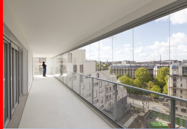
Au dernier étage, l'une des loggias offre une vue en cinémascope sur la ville.

Le contexte est assez particulier... Une parcelle sise entre le « vieux » Paris et un morceau de ville réinventé autour des voies SNCF, la Zac de Clichy-Batignolles, peuplée de nouvelles constructions aux architectures très variées. Elle comprend plusieurs secteurs dont celui dit de Saussure, à deux pas du Pont Cardinet, dans lequel se glisse l'immeuble dessiné par l'agence BVAU. Elle y inscrit un bâtiment à forte identité, facilement reconnaissable sans être ostentatoire pour autant. Le parti, ici, n'est pas de jouer sur la performance formelle, tant il est vrai que dans ce type de programme et de prospect, l'implantation et le volume global d'un bâtiment sont plus que cadrés. La marge de liberté de conception se joue sur l'organisation des logements, l'extension possible des cellules d'habitation sur l'extérieur, le rapport au voisinage et, plus largement, à la ville. C'est justement sur ces notions que l'agence BVAU a fondé l'originalité et la fonctionnalité de son projet.