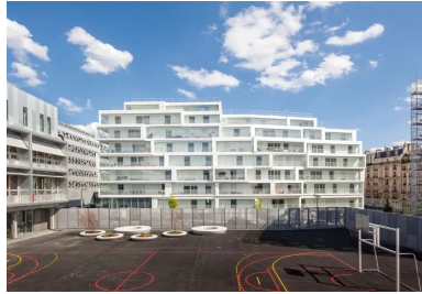
L'implémentation des boîtes suit une composition d'apparence aléatoire et pourtant rigoureuse.

Les panneaux de verre, tous identiques, ne laissaient place à aucune erreur dimensionnelle. Compte tenu de ce principe d'imbrication, les jardins d'hiver ont été installés niveau par niveau, chaque poutre devant arriver sur le chantier dans un ordre prédéterminé. Sans une conception du projet en 3D dès la phase APD, ce principe aurait été très difficile à maîtriser, tant en termes de coût que de précision dimensionnelle. Cette réalisation met en évidence l'intérêt des nouveaux outils de conception qui offrent la possibilité de créer une volumétrie sur mesure sans impliquer, entre autres, une phase d'étude trop longue ou la démultiplication des dessins de détail.