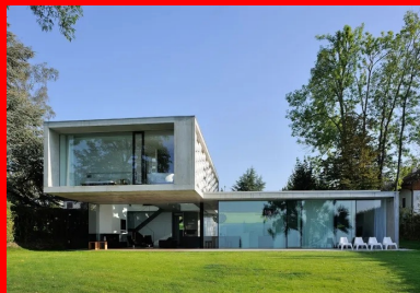
Le premier étage s'élance en direction du lac par un généreux porte-à-faux.

Cette maison bien que très vitrée est performante d'un point de vue énergétique et répond à la RT 2012. Elle est chauffée grâce à une pompe à chaleur et dispose d'une ventilation double flux. La grande façade vitrée au sud permet un apport calorifique nécessaire en hiver et les grands débords de toiture protègent des risques de surchauffe en été. Le moucharabieh du premier étage à l'ouest permet de réguler les apports calorifiques du soleil en fin de journée.