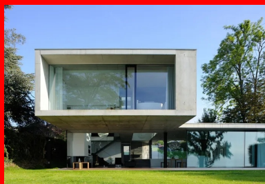
Le volume général de la maison résulte de l'assemblage de deux boîtes aux lignes très épurées.

Elles sont largement ouvertes les unes sur les autres, dans un espace fluide et généreux qui profite des vues offertes par les vastes baies vitrées, sur le lac au nord ou le jardin au sud. Un bureau prend place à l'extrémité ouest. Une chambre d'amis est aménagée dans la partie sud, avec vue sur le jardin. L'étage est réservé aux trois chambres et leurs salles de bains. Celle des parents se situe au niveau du porte-à-faux. Elle occupe une position exceptionnelle en balcon sur le site et sur le panorama du lac Léman et des monts du Jura. Les deux chambres des enfants et leur salle de jeux sont à l'autre extrémité. L'espace des parents et celui des enfants sont séparés par le vide double hauteur et reliés entre eux par une passerelle.