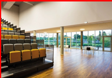
La salle polyvalente du rez-dechaussée profite aussi de la transparence sur l'extérieur.

La toiture est végétalisée pour parfaire l'isolation thermique et donner au complexe de toiture une inertie thermique vecteur de confort d'usage en assurant un gain de consommation énergétique. À l'intérieur, le béton laissé brut minimise le second œuvre . Du restaurant aux loges, son épiderme donne le ton et contribue à l'ambiance qui règne dans les différents espaces.