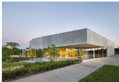
Par les découpes des vides et des pleins, l'architecture fait écho aux fonctions de l'équipement, mais aussi à sa capacité d'insertion urbaine

À terme, des arbres de haute tige créeront un filtre visuel entre le nouvel équipement culturel et festif et le cimetière. » Si le volume s'intègre en douceur dans le paysage, la matérialité de l'édifice cultive une riche opposition avec le caractère pittoresque du village où l'équipement s'affirme comme la pièce majeure du futur développement du centre-bourg. Au nord de la parcelle, le parking, perçu comme un parc arboré, favorise l'insertion de la salle de spectacle dans un paysage à dominante végétale.