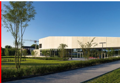
Le calme d'un parvis sous la masse protectrice du béton.