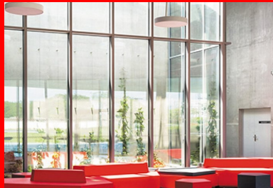
Le hall et la paroi de béton qui délimite le volume de la salle.

À l'extérieur, la volumétrie générale de cette architecture en béton matricié joue sans artifice de ses inclinaisons douces pour intégrer sans fracas le nouvel équipement dans la ville.