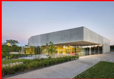
Par les découpes des vides et des pleins, l'architecture fait écho aux fonctions de l'équipement, mais aussi à sa capacité d'insertion urbaine

À terme, des arbres de haute tige créeront un filtre visuel entre le nouvel équipement culturel et festif et le cimetière. » Si le volume s'intègre en douceur dans le paysage, la matérialité de l'édifice cultive une riche opposition avec le caractère pittoresque du village où l'équipement s'affirme comme la pièce majeure du futur développement du centre-bourg. Au nord de la parcelle, le parking, perçu comme un parc arboré, favorise l'insertion de la salle de spectacle dans un paysage à dominante végétale.