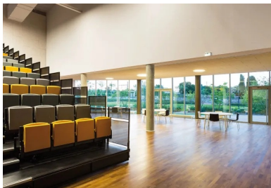
La salle polyvalente du rez-dechaussée profite aussi de la transparence sur l'extérieur.

La toiture est végétalisée pour parfaire l'isolation thermique et donner au complexe de toiture une inertie thermique vecteur de confort d'usage en assurant un gain de consommation énergétique. À l'intérieur, le béton laissé brut minimise le second œuvre . Du restaurant aux loges, son épiderme donne le ton et contribue à l'ambiance qui règne dans les différents espaces.