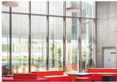
Le hall et la paroi de béton qui délimite le volume de la salle.

À l'extérieur, la volumétrie générale de cette architecture en béton matricié joue sans artifice de ses inclinaisons douces pour intégrer sans fracas le nouvel équipement dans la ville.