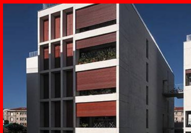
Pour chaque logement, une grande loggia de 13 m 2 offre un généreux prolongement extérieur.

Placée côté intérieur, l'isolation est réalisée classiquement par un doublage dont l'efficacité est confortée par la mise en œuvre au droit des planchers de planelles isolantes faisant office de rupteurs de ponts thermiques. Ces dispositions sont combinées à l'inertie thermique du béton et à une optimisation solaire maximale des logements tant en hiver qu'en été. Exposés est-ouest, tous profitent du large ensoleillement apporté par des baies toute hauteur. Les apports solaires conséquents sont confortés par l'absence de garde-corps opaque et régulés par les protections des brise-soleil naturellement constitués par les avancées des loggias. Forte de la conjugaison de ces facteurs, la réalisation, qui profite du label Bâtiment Basse Consommation selon la RT 2005 et d'un profil A Habitat et Environnement , propose un ensemble de logements sociaux de grande qualité d'usage.