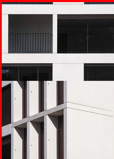
Réalisé en béton blanc, les loggias composent une peau épaisse et qualifient l'opération.

Les coûts engendrés par l'important développé de façade et la multiplication des bâtiments sont couverts par une extrême rationalisation du système constructif. Entièrement réalisés en béton, les édifices associent différentes techniques comme l'indique le plan d'étage courant (ci-dessous). Les noyaux de circulation et les espaces communs contenus dans les plots centraux sont formés par des voiles en béton armé coulés en place qui constituent les structures de contreventement. Les murs extérieurs sont montés en blocs de béton enduits sur des planchers en béton de portée limitée (6,50 m). Plaquées devant les façades principales, les loggias sont réalisées en béton blanc . Elles constituent une peau épaisse qui qualifie l'architecture de l'opération. Le système est composé d'éléments autoporteurs préfabriqués en usine. Implantés dans le prolongement des façades en parpaings enduits, les composants sont solidarisés aux corps principaux des bâtiments. Ils intègrent les rails et les dispositifs de guidage des volets roulants. À l'exception des éléments préfabriqués, les maçonneries sont protégées par un enduit à la chaux dont la finition et la teinte très claire s'allient parfaitement avec celles des panneaux de béton blanc.