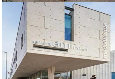
Pignon ouest, sa faille vitrée permet d'éclairer le bureau qu'il abrite. En porte-à-faux au-dessus du parvis, il définit une surface extérieure de transition dans le prolongement de l'espace des périodiques et de l'estaminet.