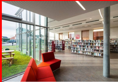
Salle de lecture et d'écoute de la médiathèque entièrement vitrée sur le jardin, les poteaux en béton implantés en retrait de la façade, signalent la structure.

Les trois volumes qui se déploient en éventail à l'arrière du premier contiennent respectivement la médiathèque et les ateliers, les bureaux de services sociaux et une salle réservée aux enfants, la salle de diffusion pouvant accueillir aussi bien des réunions, des conférences que des spectacles ou des expositions. Les façades sud des deux premiers sont vitrées sur le jardin aménagé à l'arrière. La salle de diffusion, différenciée depuis l'extérieur par son volume angulé habillé de tôles d'acier laqué perforées, peut, selon son programme, occulter toute lumière extérieure ou bien s'ouvrir complètement sur l'estaminet ou encore partiellement sur le parvis nord-ouest. La partie organisée en ateliers - cuisine, musique, etc. - peut communiquer directement avec la médiathèque ou, à l'inverse, s'en isoler pour accueillir des usagers directement depuis la rue Louis Legay. Toute la parcelle est occupée, entre le bâtiment, le parvis et le jardin.