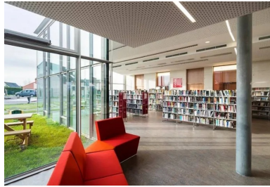
Salle de lecture et d'écoute de la médiathèque entièrement vitrée sur le jardin, les poteaux en béton implantés en retrait de la façade, signalent la structure.

Les trois volumes qui se déploient en éventail à l'arrière du premier contiennent respectivement la médiathèque et les ateliers, les bureaux de services sociaux et une salle réservée aux enfants, la salle de diffusion pouvant accueillir aussi bien des réunions, des conférences que des spectacles ou des expositions. Les façades sud des deux premiers sont vitrées sur le jardin aménagé à l'arrière. La salle de diffusion, différenciée depuis l'extérieur par son volume angulé habillé de tôles d'acier laqué perforées, peut, selon son programme, occulter toute lumière extérieure ou bien s'ouvrir complètement sur l'estaminet ou encore partiellement sur le parvis nord-ouest. La partie organisée en ateliers - cuisine, musique, etc. - peut communiquer directement avec la médiathèque ou, à l'inverse, s'en isoler pour accueillir des usagers directement depuis la rue Louis Legay. Toute la parcelle est occupée, entre le bâtiment, le parvis et le jardin.