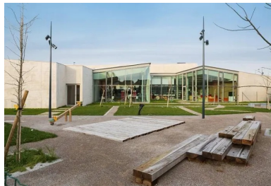
À l'arrière, les salles transparentes de la médiathèque semblent incluses dans le jardin.

Édifiée à la convergence des trois cités, créant un lien matériel et visuel, elle achève de donner une centralité, là où auparavant se trouvait un terrain vacant. Équipement public original, elle rassemble des fonctions traditionnellement éparpillées – services municipaux, café, salle de spectacle, etc. Dans un même bâtiment, les visiteurs peuvent passer du temps à consulter un livre, un journal, tout en attendant un rendez-vous à la PMI et en buvant un café ou une « Page 24 », une bière locale au nom prédestiné. Parce qu'elle est incluse au milieu d'autres activités, éventuellement soutenue par des animations, la lecture devient accessible à tous. C'est du moins le pari qui est fait là.