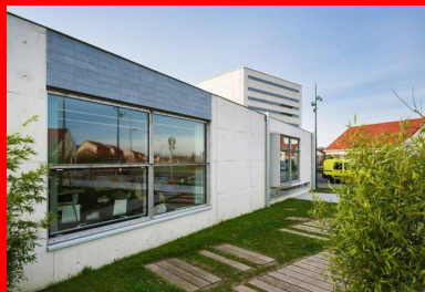
Façade orientée à l'est, à l'abri de la circulation.

Le soutien de la région Nord-Pas-de-Calais a été déterminant, tant sur le plan financier (80 % du budget) que pour le montage du projet qui aura pris trois ans. Toutes les étapes du projet se sont déroulées en concertation avec les élus, mais aussi avec les habitants, invités régulièrement à participer à des réunions d'information puis à suivre le déroulement du chantier et jusqu'à l'inauguration à laquelle tous étaient conviés ; 4 000 personnes étaient présentes. Depuis, ouverte 6 jours sur 7 à raison de 44 heures hebdomadaires, la médiathèque accueille en moyenne 200 personnes par jour de tous âges et de toutes origines ! Le nombre d'inscrits comme de prêts a explosé. Elle a reçu le prix de l'accueil au Grand Prix Livres Hebdo 2015 de bibliothèques francophones.