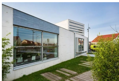
Façade orientée à l'est, à l'abri de la circulation.

Le soutien de la région Nord-Pas-de-Calais a été déterminant, tant sur le plan financier (80 % du budget) que pour le montage du projet qui aura pris trois ans. Toutes les étapes du projet se sont déroulées en concertation avec les élus, mais aussi avec les habitants, invités régulièrement à participer à des réunions d'information puis à suivre le déroulement du chantier et jusqu'à l'inauguration à laquelle tous étaient conviés ; 4 000 personnes étaient présentes. Depuis, ouverte 6 jours sur 7 à raison de 44 heures hebdomadaires, la médiathèque accueille en moyenne 200 personnes par jour de tous âges et de toutes origines ! Le nombre d'inscrits comme de prêts a explosé. Elle a reçu le prix de l'accueil au Grand Prix Livres Hebdo 2015 de bibliothèques francophones.