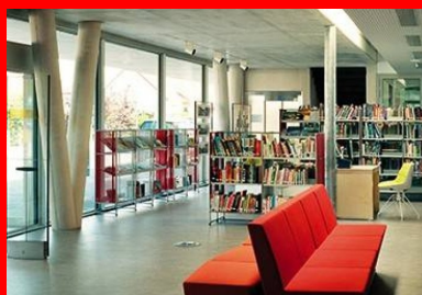
Hall d'entrée où s'avance la salle de lecture, le plafond béton, correspond à la partie du bâtiment de deux niveaux, une faille vitrée marque la transition avec la partie de plain-pied.

Par ailleurs, l'association de la massivité du béton, de l'étanchéité des terrasses végétalisées avec la transparence et la finesse des façades en verre permet d'obtenir une inertie thermique importante et d'assurer la conformité à la RT 2012. Le confort d'été comme d'hiver est assuré, tout en privilégiant l'éclairage naturel.