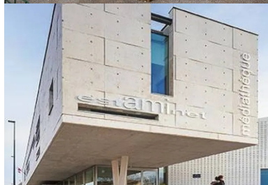
Pignon ouest, sa faille vitrée permet d'éclairer le bureau qu'il abrite. En porte-à-faux au-dessus du parvis, il définit une surface extérieure de transition dans le prolongement de l'espace des périodiques et de l'estaminet.