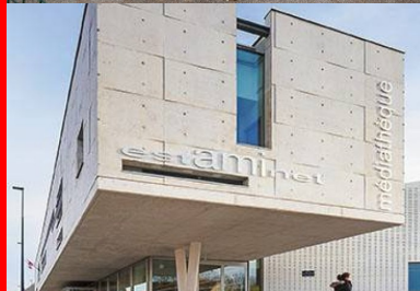
Pignon ouest, sa faille vitrée permet d'éclairer le bureau qu'il abrite, en porte-à-faux au-dessus du parvis, il définit une surface extérieure de transition dans le prolongement de l'espace des périodiques et de l'estaminet.