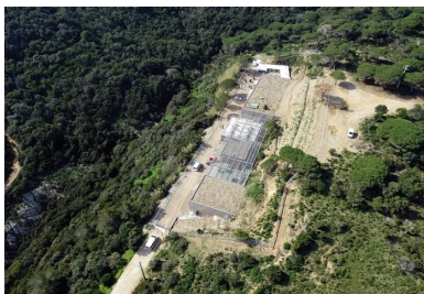
La toiture en partie végétalisée avec des espèces locales, complète l'intégration.

Par ailleurs, pour des raisons d'accès (la route est très étroite), tous les panneaux préfabriqués du « sarcophage » ont été coulés sur le chantier.