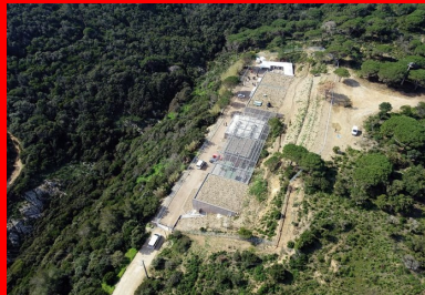
La toiture en partie végétalisée avec des espèces locales, complète l'intégration.

Par ailleurs, pour des raisons d'accès (la route est très étroite), tous les panneaux préfabriqués du « sarcophage » ont été coulés sur le chantier.