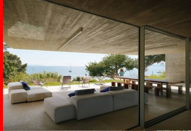
Les espaces communs ouvrent sur un vaste salon d'été protégé des pluies, du vent et du soleil brûlant du midi par un généreux porte-à-faux.

Issu d'un lotissement des années 70, le terrain est une pépite de la Riviera, réservée à sa descendance par l'acquéreur de l'époque. Il comprend deux accès. Un premier depuis la route supérieure, un second au bout d'une petite voie descendant vers la côte. C'est par ce chemin bas que l'on accède aujourd'hui à la propriété, comme si l'on arrivait de la mer. Là, entre la plage et les premiers contreforts rocheux, se développe le pavillon d'entrée : un long parallépipède revêtu de bois sous lequel sont aménagés les garages. Sa toiture-terrasse accueille un deck que prolonge une piscine à débordement, rectangulaire et longiligne. Ainsi disposé, le bassin en inox trace une ligne d'eau turquoise dans le paysage verdoyant. Implantée au-dessus, la maison principale est desservie par les circulations douces qui gravissent les terrasses du jardin et par un ascenseur qui perforé la roche pour rejoindre les hauteurs.