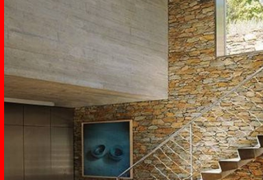
Depuis l'intérieur, le panorama s'offre par des ouvertures tour à tour vastes comme des écrans géants, ou cadrées comme des plans fixes.