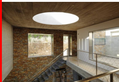
Depuis l'intérieur, le panorama s'offre par des ouvertures tour à tour vastes comme des écrans géants, ou cadrées comme des plans fixes.