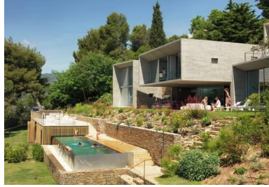
Le béton brut, le verre et la pierre sèche dialoguent avec la végétation luxuriante de la riviera.

Tout d'abord, on voit la mer. Transparente et énigmatique, avec des profondeurs bleues et vertes et, à l'horizon, ces îles qu'on surnomme d'Or tant leurs parois de micascistes scintillent sous le soleil. Ensuite, il y a la côte. Un trait volcanique qui dissimule des criques sablonneuses au creux des rochers. Et puis, on découvre cette pente dévalant jusqu'à la Grande Bleue, ce morceau de maquis, couvert d'une végétation luxuriante où se mêlent pins d'Alep, myrtes, romarins, pistachiers, et tant d'autres espèces odorantes. Enfin, on découvre quelques murets de pierres sèches traçant, parallèlement à la plage, les indices d'une ancienne présence humaine. Et rien de plus, si ce n'est le bruissement des cigales sous le soleil.