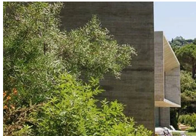
Les parois extérieures, les plafonds et les refends intérieurs sont réalisés en béton brut dans des coffrages en pin.

La commande est simple, aussi simple que le site est merveilleux : une maison de vacances pour vivre au grand air, en lien avec la nature. Il faut envisager le maximum de chambres par rapport à la constructibilité autorisée de manière à accueillir en toute intimité les quatre générations de la famille - de l'aïeule aux arrière-petits-enfants - ainsi que les proches amis. Les pièces doivent donc être nombreuses. Une dizaine, de taille raisonnable, toutes équipées d'une salle de bains et complétées par de généreux espaces communs : une cuisine ouverte sur la salle à manger, un séjour, un vaste salon d'été doté d'une grande table placée à l'abri des pluies, du vent et du soleil brûlant du Midi. Le tout, bien sûr, ouvert sur la Méditerranée.