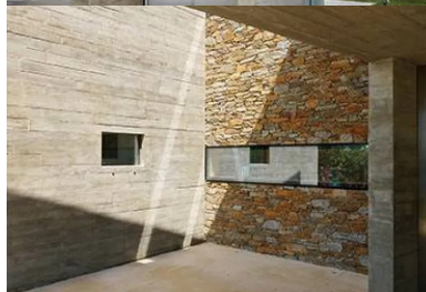
Les parois extérieures, les plafonds et les refends intérieurs sont réalisés en béton brut dans des coffrages en pin.