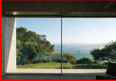
Depuis l'intérieur, le panorama s'offre par des ouvertures tour à tour vastes comme des écrans géants, ou cadrées comme des plans fixes.

Le projet profite également d'un chauffage au sol et d'une ventilation double flux mais c'est bien grâce à l'inertie du béton et à une conception bioclimatique en parfaite concordance avec le site qu'est assuré le confort de cette résidence exposée au souffle brûlant de l'été comme aux pluies de l'hiver.