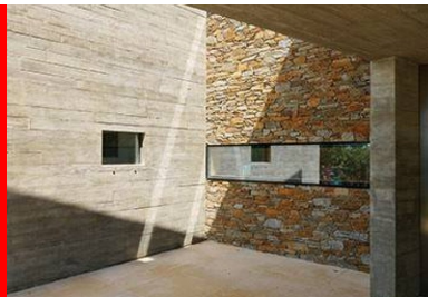
Les parois extérieures, les plafonds et les refends intérieurs sont réalisés en béton brut dans des coffrages en pin.