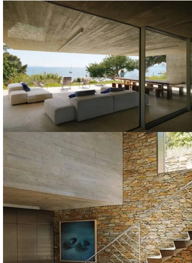
Les espaces communs ouvrent sur un vaste salon d'été protégé des pluies, du vent et du soleil brûlant du midi par un généreux porte-à-faux.

Issu d'un lotissement des années 70, le terrain est une pépîte de la Riviera, réservée à sa descendance par l'acquéreur de l'époque. Il comprend deux accès. Un premier depuis la route supérieure, un second au bout d'une petite voie descendant vers la côte. C'est par ce chemin bas que l'on accède aujourd'hui à la propriété, comme si l'on arrivait de la mer. Là, entre la plage et les premiers contreforts rocheux, se développe le pavillon d'entrée : un long parallélépipède revêtu de bois sous lequel sont aménagés les garages. Sa toiture-terrasse accueille un deck que prolonge une piscine à débordement, rectangulaire et longiligne. Ainsi disposé, le bassin en inox trace une ligne d'eau turquoise dans le paysage verdoyant. Implantée au-dessus, la maison principale est desservie par les circulations douces qui gravissent les terrasses du jardin et par un ascenseur qui perfore la roche pour rejoindre les hauteurs.