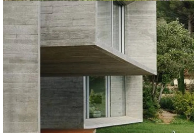
Les parois extérieures, les plafonds et les refends intérieurs sont réalisés en béton brut dans des coffrages en pin.