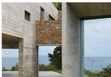
Les parois extérieures, les plafonds et les refends intérieurs sont réalisés en béton brut dans des coffrages en pin.