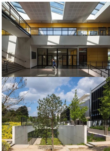
La galerie distribue la salle polyvalente, la restauration, le CDI et l'administration. Ici, vue sur l'accès au restaurant.

Une grande Douve creusée entre cour et jardin révèle leur présence. Elle accueille des patios plantés, sur lesquels s'ouvrent les ateliers par de vastes baies vitrées. Aujourd'hui, les 2 100 élèves du lycée disposent d'un environnement naturel agréable.