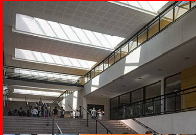
Baignée de lumière naturelle et large de 12 m, la galerie relie l'entrée et l'Atrium.

L'établissement souffrait d'une certaine vétusté, ainsi que de l'inadaptation ou de l'absence de certains espaces pédagogiques devant répondre aux exigences contemporaines de l'enseignement et de la vie scolaire. À partir de 2009, il a fait durant 6 ans l'objet de travaux de restructuration et de rénovation en site occupé qui se sont déroulés en 4 phases et se sont achevés à la rentrée de septembre 2015. Le projet conçu et conduit par André Chantalat et Gérard Liucci renouvelle l'image du lycée Richelieu tout en conservant et en valorisant les qualités et l'esprit du lieu. Les deux bâtiments d'enseignement général existants dominent le site et inscrivent l'établissement dans sa topographie. Ils ont été entièrement rénovés et restructurés et sont reliés l'un à l'autre par un nouveau bâtiment. Sur les 3 niveaux, les circulations de liaison sont lisibles depuis un généreux Atrium.