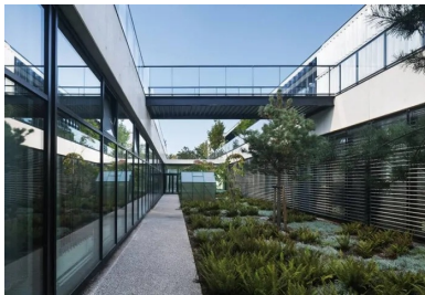
Les ateliers s'ouvrent sur les patios plantés de la douve.