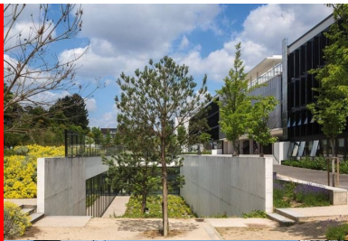
Vue sur les jardins et sur la douve des ateliers.