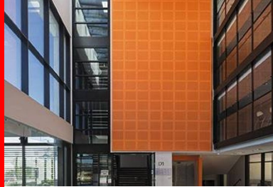
L'Atrium assure la connexion entre les bâtiments d'enseignement.