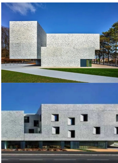
L'entrée est signifiée par un volume en porte-à-faux de 17m dont la mise en lévitation crée un appel.

« Ce bâtiment propose une morphologie et une échelle qui expriment une certaine force dans l'esprit du lieu et de son histoire. C'est un monolithe de béton qui affiche une présence énigmatique. La matière du béton brut manifeste parfaitement ici le volume et la masse recherchés. Cependant, je ne voulais pas que le parement reste totalement brut. Je souhaitais donner un ton un peu bleuté au béton et que sa peau soit en écho avec la végétation du bois d'Essert. Pour répondre à ces objectifs, l'idée de réaliser un dripping sur les façades avec deux teintes de bleu s'est imposée. Cela permet de laisser le béton vivre tout en lui donnant une texture bleutée inhabituelle. Les jets de peinture donnent de la profondeur et une épaisseur à la peau du bâtiment. Les surfaces vibrent sous la lumière, elles semblent en mouvement, la matière n'est plus statique. Il est aussi très intéressant de constater que certaines personnes pensent à des marbres, tandis que d'autres y voient un motif plutôt végétal. Chacun peut avoir sa lecture et son interprétation de cette texture », commente Dominique Coulon.