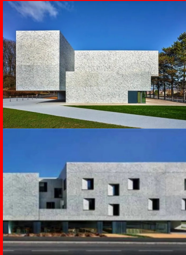
L'entrée est signifiée par un volume en porte-à-faux de 17m dont la mise en lévitation crée un appel.

« Ce bâtiment propose une morphologie et une échelle qui expriment une certaine force dans l'esprit du lieu et de son histoire. C'est un monolithe de béton qui affiche une présence énigmatique. La matière du béton brut manifeste parfaitement ici le volume et la masse recherchés. Cependant, je ne voulais pas que le parement reste totalement brut. Je souhaitais donner un ton un peu bleuté au béton et que sa peau soit en écho avec la végétation du bois d'Essert. Pour répondre à ces objectifs, l'idée de réaliser un dripping sur les façades avec deux teintes de bleu s'est imposée. Cela permet de laisser le béton vivre tout en lui donnant une texture bleutée inhabituelle. Les jets de peinture donnent de la profondeur et une épaisseur à la peau du bâtiment. Les surfaces vibrent sous la lumière, elles semblent en mouvement, la matière n'est plus statique. Il est aussi très intéressant de constater que certaines personnes pensent à des marbres, tandis que d'autres y voient un motif plutôt végétal. Chacun peut avoir sa lecture et son interprétation de cette texture », commente Dominique Coulon.