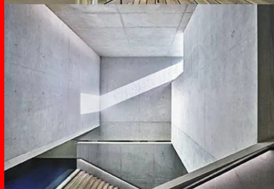
L'espace généreux et lumineux du hall se dilate dans le bâtiment.