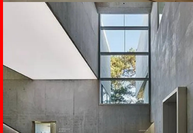
le hall est le cœur du conservatoire. le volume de la bibliothèque, disposé en pont sur le hall, vient ponctuer la dilatation verticale de l'espace.