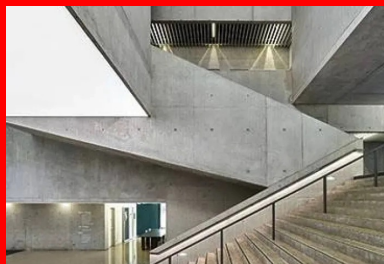
L'espace généreux et lumineux du hall se dilate dans le bâtiment.

Le dripping sur les façades a été réalisé par deux artistes, Max Coulon et Gabriel Khokha. Ils ont fabriqué des pinces spéciales et mis au point la technique de projection spécifique. Ce sont deux nuances de bleu d'une peinture extérieure pour bâtiment qui ont été projetées à partir d'une nacelle, sur les façades en béton brut préalablement recouvertes d'une protection hydrofuge . L'ensemble de cette intervention s'est déroulé sur environ un mois et demi.