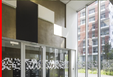
Les deux halls d'entrée se déploient sur une double hauteur, à la manière d'un espace tampon entre extérieur et intérieur.