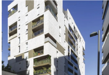
Le volume des logements s'érige à la manière d'une tour totem de 11 niveaux.

La position du terrain, implanté en lisière de la ZAC, imposait à la nouvelle construction une fonction de « fond de scène ». Enfin, il apparaissait comme primordial pour les architectes de tirer le meilleur parti de la relative petitesse de la surface à disposition. En effet, les différents îlots réservés aux immeubles de logements illustrent le choix qui a été fait de la densité. Ce parti pris, a permis de « libérer » et de consacrer plus de 10 % de la surface de la ZAC à la création d'un parc paysager de 12 hectares. Pour allier au mieux densité des constructions et vues sur le parc ou le paysage au lointain, les volumes des différents immeubles sont implantés suivant un dispositif en quinconce, de façon, également, à laisser pénétrer le soleil en cœur d'îlot.