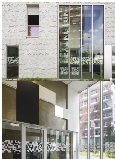
Une modénature au relief subtil inspiré par les QR codes et repris comme motif pour signer l'identité de la réalisation.

Dans cet esprit de confort et de qualité de vie, les architectes ont ici fait le choix de systématiser le placement des séjours dans les angles et de les accompagner de loggias, excepté pour quelques-unes des petites surfaces de type T1 ou T2. Ce principe qui consiste à creuser le volume construit et à créer un certain relief est devenu le fer de lance du projet.