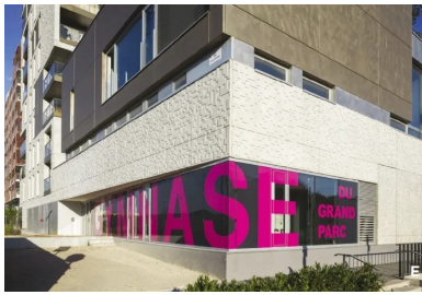
Jeu de contraste entre les panneaux de béton blanc et les panneaux de béton lisse recouverts d'une peinture métallisée.