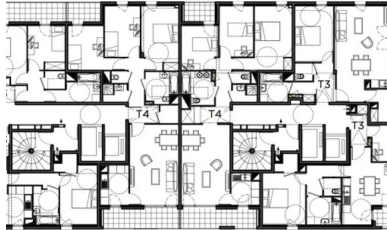
Plan d'étage courant

L'ensemble de la construction a été majoritairement réalisé en béton, structures et façades. La plupart des éléments ont été coulés en place. Seuls les panneaux de façade en béton blanc autoplaçant ont été préfabriqués. Réalisés à l'aide d'une matrice sur mesure reprenant le dessin élaboré par les architectes sur la base d'un QR code, ils forment la peau des deux volumes, gymnase et logements, et en font l'une des principales particularités du bâtiment. Chaque panneau de 2,80 x 2,84 cm correspond à une hauteur d'étage, dalle comprise. De nombreux essais ont été nécessaires, d'une part, pour aboutir à la couleur souhaitée, en associant du ciment blanc à un colorant de teinte grise, et d'autre part, pour obtenir l'exactitude du relief recherché, de 1 cm de profondeur. Enfin, pour gérer au mieux le calepinage des panneaux et de tous les autres éléments, et surtout l'ensemble des détails de réalisation, un échantillon en vraie grandeur a été réalisé, représentant une hauteur d'étage sur 10 m de long avec raccord d'angle et plancher. Outre les garde-corps, il met en scène le contraste entre le relief de la peau en béton blanc et les panneaux de béton recouverts d'une peinture métallisée qui, tantôt accentuent l'effet de profondeur des « vides » (les fonds de loggias), tantôt participent à la composition des façades en jouant l'alternance avec les panneaux matricés.