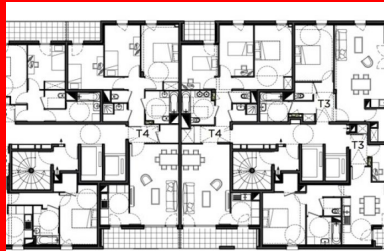
Plan d'étage courant

L'ensemble de la construction a été majoritairement réalisé en béton, structures et façades. La plupart des éléments ont été coulés en place. Seuls les panneaux de façade en béton blanc autoportant ont été préfabriqués. Réalisés à l'aide d'une matrice sur mesure reprenant le dessin élaboré par les architectes sur la base d'un QR code, ils forment la peau des deux volumes, gymnase et logements, et en font l'une des principales particularités du bâtiment. Chaque panneau de 2,80 x 2,84 cm correspond à une hauteur d'étage, dalle comprise. De nombreux essais ont été nécessaires, d'une part, pour aboutir à la couleur souhaitée, en associant du ciment blanc à un colorant de teinte grise, et d'autre part, pour obtenir l'exactitude du relief recherché, de 1 cm de profondeur. Enfin, pour gérer au mieux le calage des panneaux et de tous les autres éléments, et surtout l'ensemble des détails de réalisation, un échantillon en vraie grandeur a été réalisé, représentant une hauteur d'étage sur 10 m de long avec raccord d'angle et plancher. Outre le garde-corps, il met en scène le contraste entre le relief de la peau en béton blanc et les panneaux de béton recouverts d'une peinture métallisée qui, tantôt accentuent l'effet de profondeur des « vides » (les fonds de loggias), tantôt participent à la composition des façades en jouant l'alternance avec les panneaux matricés.