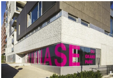
Jeu de contraste entre les panneaux de béton blanc et les panneaux de béton lisse recouverts d'une peinture métallisée.