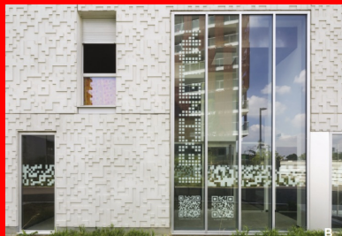
Une modénature au relief subtil inspiré par les QR codes et repris comme motif pour signer l'identité de la réalisation.

Dans cet esprit de confort et de qualité de vie, les architectes ont ici fait le choix de systématiser le placement des séjours dans les angles et de les accompagner de loggias, excepté pour quelques-unes des petites surfaces de type T1 ou T2. Ce principe qui consiste à creuser le volume construit et à créer un certain relief est devenu le fer de lance du projet.