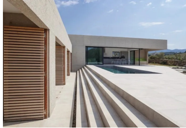
Dans le volume qui domine la composition sont regroupés les lieux de la vie commune, qui s'ouvrent sur l'extérieur et la piscine par une généreuse baie vitrée en angle.