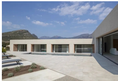
Chaque chambre est conçue comme un studio indépendant et toutes possèdent une loggia donnant sur la piscine.

La maison est construite en béton coulé en place avec des voiles de refend et des murs de façade porteurs. Les voiles intérieurs ont un parement brut de décoffrage , animé par l'empreinte des panneaux en épica mis en œuvre dans les bandes de coffrage métalliques. Toutes les parois en béton en contact avec l'extérieur sont sablées. Elles laissent apparaître un gravier blanc, sec et aux arêtes franches qui fait écho aux collines de calcaire. Ainsi, l'expression minérale de cette architecture entre en résonance avec le site et l'esprit du lieu.