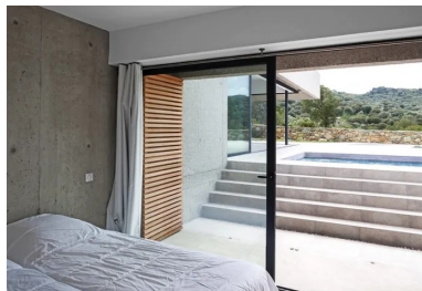
Vue depuis une chambre.

La maison est construite en béton coulé en place avec des voiles de refend et des murs de façade porteurs. Les voiles intérieurs ont un parement brut de décoffrage , animé par l'empreinte des panneaux en épica mis en œuvre dans les bandes de coffrage métalliques. Toutes les parois en béton en contact avec l'extérieur sont sablées. Elles laissent apparaître un gravier blanc, sec et aux arêtes franches qui fait écho aux collines de calcaire. Ainsi, l'expression minérale de cette architecture entre en résonance avec le site et l'esprit du lieu.