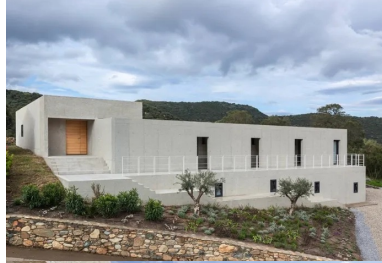
La maison se déploie par un jeu de volumes en béton sablé aménagés dans la pente.

« Un coup de pelle a suffi à révéler le secret géologique d'Oletta, laissant apparaître, à la lumière crue, un radeau de calcaire perdu au milieu de ce cirque granitique qu'est la Corse », expliquent les architectes Buzzo et Spinelli. « La tendresse de cette pierre nous a invités à penser le projet non plus comme un édifice, mais à concevoir l'espace en creux. Le projet naît de l'idée de la mise au jour d'une masse minérale monolithique extraite du sol. Comme la pièce de glaise déposée sur le tour du potier, le bloc s'installe en promontoire sur le terrain pour offrir sa masse aux ciseaux du sculpteur. »