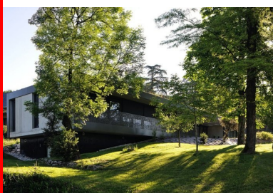
La maison tourne volontairement le dos aux constructions avoisinantes, côté nord, a n d'orienter tous les espaces vers le sud et les vues dégagées sur le paysage. La toiture-terrasse est entièrement végétalisée de façon intensive.