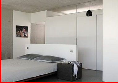
Vue d'une chambre.