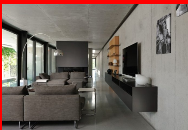
Le béton brut et la lumière naturelle caractérisent tous les espaces intérieurs. Vue sur le séjour et le couloir qui traverse la maison dans toute sa longueur.

Des lanterneaux rectangulaires percés dans la toiture « comme des coups de cutter » créent des ponctuations lumineuses dans le long couloir. On retrouve le même dispositif au-dessus de la piscine et au niveau du sas conduisant à la porte d'entrée.