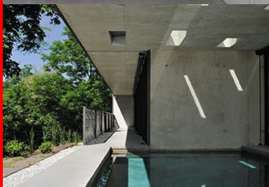
Tout en étant extérieure, la piscine est inscrite dans le volume de la maison.

La maison est construite en béton coulé en place. La dalle de toiture est portée par le grand mur et des voiles transversaux qui séquent l'espace. La façade nord est entièrement recouverte de végétation. Le long voile de béton de 50 m, laissé brut à l'intérieur, est isolé par l'extérieur. L'isolant est protégé par un étanchéité et un grillage est disposé pour recevoir la végétation qui la colonise. La toiture-terrasse est elle aussi isolée par l'extérieur et entièrement végétalisée de façon intensive. La terre végétale qui se trouvait sur l'emprise de la construction a été décapée et stockée. Cette même terre a été ensuite reposée sur la toiture, sur une épaisseur de 50 cm. Ainsi, les plantes présentes sur le terrain ont rapidement repoussé, comme si le sol naturel avait été posé sur la toiture.