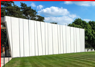
Une modénature de façade en symbiose avec les troncs des arbres avoisinants.

L'entreprise de préfabrication béton et le charpentier bois ont travaillé de concert pour déterminer la solution la plus efficace d'un point de vue technique et esthétique. Et le résultat est là.