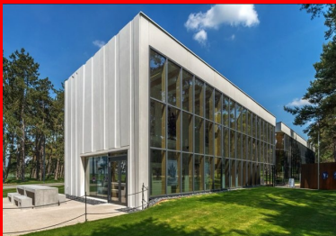
Façade ouest, le volume de béton se creuse face à la forêt.

Le système de façade a été choisi parce qu'il correspondait au mieux aux contraintes techniques qu'impliquait la modénature souhaitée par l'architecte. Ainsi, pour obtenir une représentation stylisée de la forêt de troncs, les joints verticaux entre panneaux devaient être inclinés, mais également avoir une position sans symétrie apparente pour éviter l'effet d'un motif répétitif et ainsi insuffler la dimension aléatoire du paysage naturel au dessin des façades. Les panneaux toute hauteur n'ont de ce fait pas tous la même largeur, ni la même forme. Dans chacun des moules ont été intégrés plusieurs inserts, de trois types différents, symbolisant plusieurs modèles de tronc. Pour affiner encore un peu plus le dessin, rendre les effets d'ombre plus intéressants et élargir le jeu des inclinaisons, les inserts n'ont pas la même profondeur en haut et en bas du panneau.