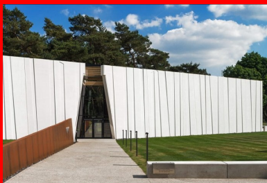
Le second axe, axe de l'histoire, est symbolisé par une lame en acier corten qui guide le visiteur vers l'entrée.

Vu depuis la clairière et la route d'accès, le bâtiment se présente comme un volume opaque dont les trois faces visibles sont enveloppées d'une peau de béton blanc , en écho à la pierre utilisée pour réaliser le monument ancré sur la crête. Seule l'entrée marque une rupture dans cette boîte constituée sur trois côtés de grands panneaux monolithiques au relief subtil, imprimant au volume une poésie en symbiose avec le lieu. L'inclinaison des joints verticaux entre panneaux mime celle des troncs d'arbres, un jeu graphique renforcé par l'ajout d'inserts dans les panneaux. Ces façades en relief créent une identité forte, faisant apparaître le bâtiment comme un écran abritant un contenu précieux, et cela sans aucune ostentation. Au contraire. En effet, ces reliefs dialoguent avec les arbres plantés pour rendre hommage aux soldats disparus. Les façades ne se lisent plus comme une peau épaisse mais bien comme une matière vivante et légère dont l'aspect change en fonction du temps et des saisons.