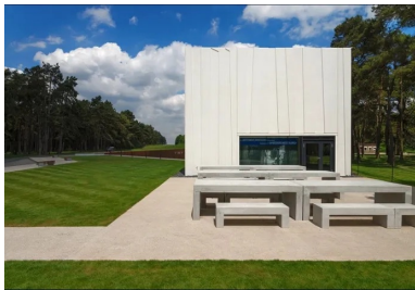
Le centre d'accueil a trouvé sa place sur la surface la moins accidentée du terrain.