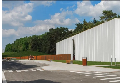
Le mémorial, installé sur la crête, et le volume du centre d'accueil s'alignent pour former l'axe de mémoire.

Ce contexte explique la particularité du lieu et l'aménagement qui en a été fait. Le souci de mémoire se traduit, pour les Canadiens, par une préservation de la topographie du champ de bataille, ses circonvolutions, ses tranchées et galeries, et par la conservation de tout mètre cube de terre creusé et déplacé. Le site, aujourd'hui très boisé, est marqué par une forêt de troncs et par sa pelouse qui ondule quasi à perte de vue. Toujours dans un souci de mémoire et surtout de transmission à sa jeunesse, l'état canadien souhaitait intégrer sur le site du Mémorial national du Canada un centre d'accueil et d'éducation, inauguré lors des célébrations du centenaire de la bataille du 9 avril 1917.