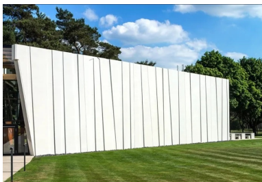
Une modénature de façade en symbiose avec les troncs des arbres avoisinants.

L'entreprise de préfabrication béton et le charpentier bois ont travaillé de concert pour déterminer la solution la plus efficace d'un point de vue technique et esthétique. Et le résultat est là.