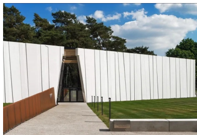
Le second axe, axe de l'histoire, est symbolisé par une lame en acier corten qui guide le visiteur vers l'entrée.

Vu depuis la clairière et la route d'accès, le bâtiment se présente comme un volume opaque dont les trois faces visibles sont enveloppées d'une peau de béton blanc , en écho à la pierre utilisée pour réaliser le monument ancré sur la crête. Seule l'entrée marque une rupture dans cette boîte constituée sur trois côtés de grands panneaux monolithiques au relief subtil, imprimant au volume une poésie en symbiose avec le lieu. L'inclinaison des joints verticaux entre panneaux mime celle des troncs d'arbres, un jeu graphique renforcé par l'ajout d'inserts dans les panneaux. Ces façades en relief créent une identité forte, faisant apparaître le bâtiment comme un écran abritant un contenu précieux, et cela sans aucune ostentation. Au contraire. En effet, ces reliefs dialoguent avec les arbres plantés pour rendre hommage aux soldats disparus. Les façades ne se lisent plus comme une peau épaisse mais bien comme une matière vivante et légère dont l'aspect change en fonction du temps et des saisons.