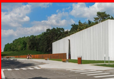
Le mémorial, installé sur la crête, et le volume du centre d'accueil s'alignent pour former l'axe de mémoire.

Ce contexte explique la particularité du lieu et l'aménagement qui en a été fait. Le souci de mémoire se traduit, pour les Canadiens, par une préservation de la topographie du champ de bataille, ses circonvolutions, ses tranchées et galeries, et par la conservation de tout mètre cube de terre creusé et déplacé. Le site, aujourd'hui très boisé, est marqué par une forêt de troncs et par sa pelouse qui ondule quasi à perte de vue. Toujours dans un souci de mémoire et surtout de transmission à sa jeunesse, l'état canadien souhaitait intégrer sur le site du Mémorial national du Canada un centre d'accueil et d'éducation, inauguré lors des célébrations du centenaire de la bataille du 9 avril 1917.