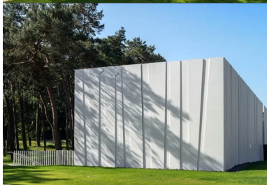
Une architecture du détail aboutissant à un volume épuré aux lignes nettes.