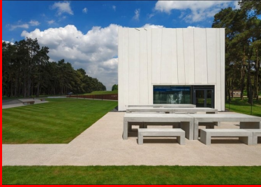
Le centre d'accueil a trouvé sa place sur la surface la moins accidentée du terrain.