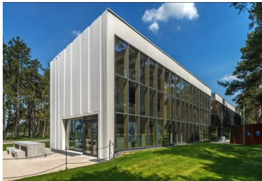
Façade ouest, le volume de béton se creuse face à la forêt.

Le système de façade a été choisi parce qu'il correspondait au mieux aux contraintes techniques qu'impliquait la modénature souhaitée par l'architecte. Ainsi, pour obtenir une représentation stylisée de la forêt de troncs, les joints verticaux entre panneaux devaient être inclinés, mais également avoir une position sans symétrie apparente pour éviter l'effet d'un motif répétitif et ainsi insuffler la dimension aléatoire du paysage naturel au dessin des façades. Les panneaux toute hauteur n'ont de ce fait pas tous la même largeur, ni la même forme. Dans chacun des moules ont été intégrés plusieurs inserts, de trois types différents, symbolisant plusieurs modèles de tronc. Pour affiner encore un peu plus le dessin, rendre les effets d'ombre plus intéressants et élargir le jeu des inclinaisons, les inserts n'ont pas la même profondeur en haut et en bas du panneau.