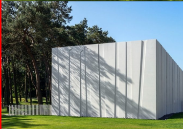
Une architecture du détail aboutissant à un volume épuré aux lignes nettes.