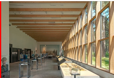
La salle d'exposition communie avec la forêt et le champ de bataille.