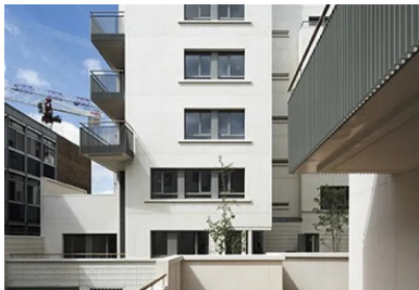
Vue sur des loggias d'angle.