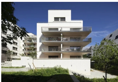
La plupart des logements bénéficient de plusieurs orientations.

Tout en s'appropriant les contraintes du PLU, il creuse les volumes pour offrir des vues et instaure de subtils décalages dans les angles pour faire entrer la lumière. Il concilie très habilement densité et intimité. Ceci se traduit par une très grande diversité dans la typologie des logements qui échappe à toute standardisation d'un plan d'étage courant et optimise partout l'espace et les vues pour compenser les limites de surfaces qu'imposent des programmes en accession. La lumière naturelle a été favorisée pour l'ensemble des escaliers collectifs, les locaux communs situés en rez-de-chaussée et les logements. Aux trois angles de la cour, chacun des escaliers dessert trois ou quatre logements par niveau et 85 % de ces appartements disposent de plusieurs orientations. Si les séjours des plus grands, tous traversants, sont tournés vers le sud avec des prolongements extérieurs d'une profondeur de 2 m dont certains s'apparentent à des jardins d'hiver, l'architecte valorise également les vues sur Paris au nord. Les logements des niveaux supérieurs sont agrémentés de très grandes terrasses résultant des retraits successifs du plan d'épannelage et les toitures sont l'occasion d'offrir des surhauteurs dans les séjours sous rampant (jusqu'à 4 m de haut) et des éclairages zénithaux. Les toitures des derniers niveaux abritent un étage technique permettant d'intégrer au sein du volume bâti des équipements comme les moteurs d'ascenseur ou de VMC, etc.