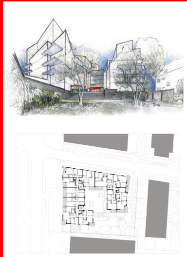
Plan de R+2

La fluidité du béton autoplaçant a permis de réaliser sans vibreur des voiles de 18 à 20 cm d'épaisseur et d'autres légèrement incurvés pour laisser glisser la lumière. En choisissant ce matériau très malléable pour ses aspects structurels et fonctionnels, l'architecte en fait aussi un élément esthétique majeur qui donne du corps à son architecture, notamment par le relief du socle matricé qui intègre des motifs de feuilles et de coquillages. Cet effet sculptural apporte du lustre au bâtiment, joue avec la lumière et dessine selon les heures des effets d'ombres géométriques.