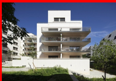
La plupart des logements bénéficient de plusieurs orientations.

Tout en s'appropriant les contraintes du PLU, il creuse les volumes pour offrir des vues et instaure de subtils décalages dans les angles pour faire entrer la lumière. Il concilie très habilement densité et intimité. Ceci se traduit par une très grande diversité dans la typologie des logements qui échappe à toute standardisation d'un plan d'étage courant et optimise partout l'espace et les vues pour compenser les limites de surfaces qu'imposent des programmes en accession. La lumière naturelle a été favorisée pour l'ensemble des escaliers collectifs, les locaux communs situés en rez-de-chaussée et les logements. Aux trois angles de la cour, chacun des escaliers dessert trois ou quatre logements par niveau et 85 % de ces appartements disposent de plusieurs orientations. Si les séjours des plus grands, tous traversants, sont tournés vers le sud avec des prolongements extérieurs d'une profondeur de 2 m dont certains s'apparentent à des jardins d'hiver, l'architecte valorise également les vues sur Paris au nord. Les logements des niveaux supérieurs sont agrémentés de très grandes terrasses résultant des retraits successifs du plan d'épannelage et les toitures sont l'occasion d'offrir des surhauteurs dans les séjours sous rampant (jusqu'à 4 m de haut) et des éclairages zénithaux. Les toitures des derniers niveaux abritent un étage technique permettant d'intégrer au sein du volume bâti des équipements comme les moteurs d'ascenseur ou de VMC, etc.