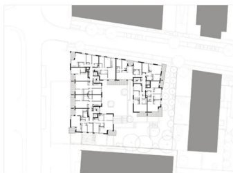
Plan de R+2