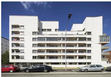
La scansion des loggias et les découpes du béton rythment la façade.

L'emplacement ayant orienté l'implantation et l'épannelage, deux volumes en R+6, séparés par une brèche, dessinent un front bâti au sud le long de la rue Baudot en accentuant un effet d'angle aigu. En contrebas, sur la rue La Pérouse, un ensemble en R+5 accompagne les constructions existantes en offrant des vues lointaines vers Paris et la banlieue. Le plan en U des constructions étant décalé par rapport au soleil, la blancheur des façades reflète la lumière dans les appartements. Les accès s'inscrivent dans la pente du terrain, une rampe et des emmarchements mènent à la cour haute qui chapeaute le parc de stationnement au niveau du rez-de-jardin . En partie basse, le jardin tire parti de l'ensoleillement du sud. Rythmés par ces variations de niveau, tous ces lieux façonnent un cœur d'îlot animé qu'un vaste porche met en relation avec la rue et les trois halls des immeubles.