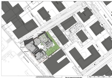
Plan vue du ciel

En une dizaine d'années, de part et d'autre des voies ferrées du pôle multimodal de Massy, des quartiers neufs se sont développés. Vers l'ouest, le pittoresque d'un style néoclassique prévaut. À l'est, sur l'ancien plateau industriel, un style plus contemporain a été recherché. Ce nouveau paysage urbain manque globalement de relief.