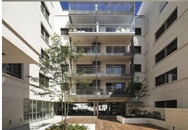
En cœur d'îlot, des espaces communs généreux sont offerts aux habitants.