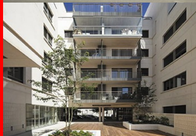
En cœur d'îlot, des espaces communs généreux sont offerts aux habitants.