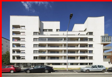
La scansion des loggias et les découpes du béton rythment la façade.

L'emplacement ayant orienté l'implantation et l'épannelage, deux volumes en R+6, séparés par une brèche, dessinent un front bâti au sud le long de la rue Baudot en accentuant un effet d'angle aigu. En contrebas, sur la rue La Pérouse, un ensemble en R+5 accompagne les constructions existantes en offrant des vues lointaines vers Paris et la banlieue. Le plan en U des constructions étant décalé par rapport au soleil, la blancheur des façades reflète la lumière dans les appartements. Les accès s'inscrivent dans la pente du terrain, une rampe et des emmarchements mènent à la cour haute qui chapeaute le parc de stationnement au niveau du rez-de-jardin . En partie basse, le jardin tire parti de l'ensoleillement du sud. Rythmés par ces variations de niveau, tous ces lieux façonnent un cœur d'îlot animé qu'un vaste porche met en relation avec la rue et les trois halls des immeubles.