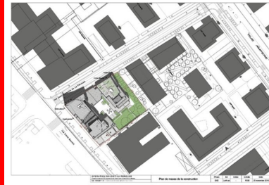
Plan vue du ciel

En une dizaine d'années, de part et d'autre des voies ferrées du pôle multimodal de Massy, des quartiers neufs se sont développés. Vers l'ouest, le pittoresque d'un style néoclassique prévaut. À l'est, sur l'ancien plateau industriel, un style plus contemporain a été recherché. Ce nouveau paysage urbain manque globalement de relief.