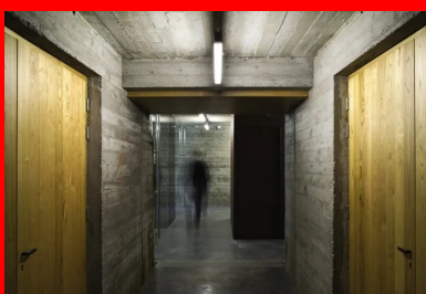
Vue des espaces du sous-sol.

Seul le mur du fond est en béton lissé à la taloche et épouse la pente du mont Gerbier. Elle est couverte par une verrière, portée par une structure en béton constituée de poutres croisées à angle droit. Ces poutres sont surdimensionnées pour obtenir une épaisseur, pour accrocher l'ombre et la lumière, pour créer un rythme de plein et de vide, qui dissimule les menuiseries de la verrière. Toutes les poutres transversales sont inclinées dans le sens de la pente. Elles composent tout un ensemble de vues cadrées en contreplongée sur le mont Gerbier-de-Jonc, qui participe à la mise en scène du lieu.