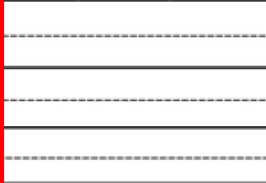
Composition des CEM II de fines de bétons recyclés

Dans ce cadre normatif, le pourcentage de clinker est compris entre 50 % et 88 %, pour les fines de bétons recyclés ente 6 % et 29 %, et pour les autres constituants tels que laitiers de haut fourneau, cendres volantes , pouzzolanes, fumée de silice , schiste calciné, et calcaire, un total ne dépassant pas 44 %.