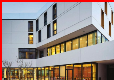
Maison de retraite EPHAD Annie Girardot, Paris. Ce projet, pilote pour la mise au point du référentiel de certification Habitat & Environnement EHPAD, porte une attention particulière au confort et à l'accessibilité des occupants, population qui doit pouvoir disposer d'un temps d'évacuation adapté à ses vulnérabilités.