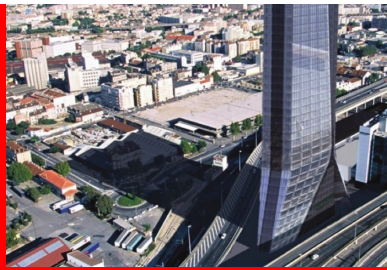
Tour CMA-CGM, Marseille. L'évacuation des immeubles de grande hauteur (IGH) est une opération longue et complexe qui nécessite tout le soutien structurel que peuvent apporter les qualités de résistance au feu du matériau béton.

Dans un bâtiment, la résistance et la stabilité au feu des matériaux et des solutions constructives doivent être privilégiées afin de faciliter l'évacuation des occupants et l'intervention des équipes de secours.