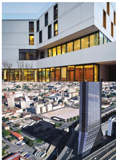
Maison de retraite EPHAD Annie Girardot, Paris. Ce projet, pilote pour la mise au point du référentiel de certification Habitat & Environnement EHPAD, porte une attention particulière au confort et à l'accessibilité des occupants, population qui doit pouvoir disposer d'un temps d'évacuation adapté à ses vulnérabilités.