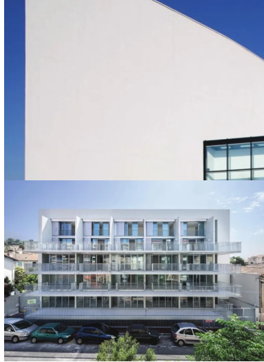
Médiathèque Hugo Pratt, Courmon L'Auvergne. Autre exemple - marquant - de réponse architecturale aux contraintes de sismicité de niveau 3.