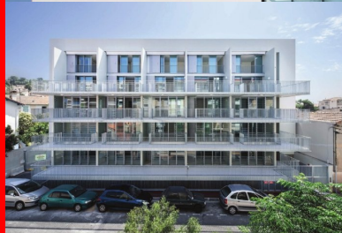
Logements, Cannes La Bocca. Les architectes de ce petit collectif ont intégré les contraintes résultantes de sa situation en zone sismique 3 avec brio.