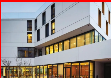
Maison de retraite EPHAD Annie Girardot, Paris. Ce projet, pilote pour la mise au point du référentiel de certification Habitat & Environnement EHPAD, porte une attention particulière au confort et à l'accessibilité des occupants, population qui doit pouvoir disposer d'un temps d'évacuation adapté à ses vulnérabilités.