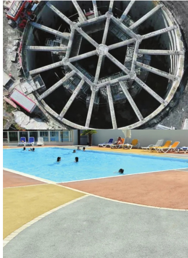
Bassin d'orage de Chaudé Rivière, Communauté urbaine de Lille. Cet ouvrage de lutte contre les inondations se compose de deux bassins circulaires en béton, reliés par un canal de surverse de l'un vers l'autre.