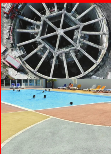
Bassin d'orage de Chaudre Rivière, Communauté urbaine de Lille. Cet ouvrage de lutte contre les inondations se compose de deux bassins circulaires en béton, reliés par un canal de surverse de l'un vers l'autre.