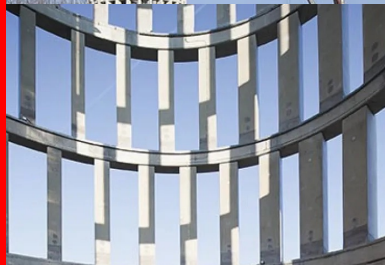
Chacune des 12 travées du fût se compose de 28 poteaux de section trapézoïdale de 4,8 m de haut encastres en pied et en tête sur les poutres annulaires.