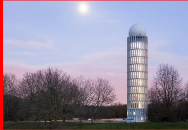
Haut de 57 m, le fût cylindrique de la tour radar se compose de 308 claires-voies ouvrant en partie basse sur le paysage et en partie haute sur le ciel et ses variations.

Composée d'éléments préfabriqués en béton, la tour radar imaginée par les architectes Barthélémy & Griño s'élève comme un signal dans le paysage du plateau de Saclay.