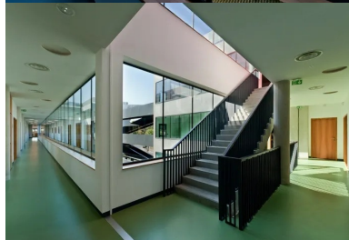
La fluidité du passage d'un étage à l'autre est favorisée par le positionnement de l'escalier dans la continuité de la circulation horizontale.