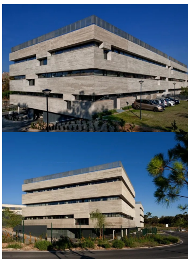
Angle est. Les panneaux des façades périphériques en béton brut de décoffrage contribuent au caractère moderne de l'édifice. Le fonctionnement intérieur est invisible depuis l'extérieur.

L'ensemble de ces exigences vise à créer des conditions de travail et de confort optimaux. Et si l'on en croit Olivier Calderon, la qualité visée et obtenue explique en partie la très grande stabilité des salariés : avec la croissance de l'entreprise, de nouveaux arrivent mais rares sont ceux qui partent.