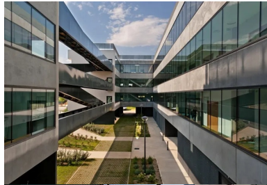
L'espace à ciel ouvert de l'atrium est un entre-deux protecteur, où la vie intérieure du bâtiment se révèle.

L'alternance des bandeaux de béton de 20 cm d'épaisseur et des bandeaux vitrés placés en retrait des façades périphériques semble se jouer des caractéristiques et du poids des matériaux : le verre semble supporter le béton. Leur réalisation a fait l'objet d'une attention particulière nécessitant un coulage du linteau et du voile en même temps, puis de l'allège. Un jeu de décrochages et d'encoches crée des ruptures dans l'horizontalité des façades. D'inspiration moderne, le bâtiment offre une qualité architecturale particulièrement remarquable dans ce secteur.