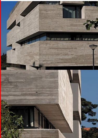
Les décalages d'éléments en béton animent le traitement horizontal des façades.