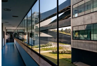
Le couloir entièrement vitré sur l'atrium.