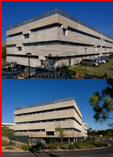
Angle est. Les panneaux des façades périphériques en béton brut de décoffrage contribuent au caractère moderne de l'édifice. Le fonctionnement intérieur est invisible depuis l'extérieur.

L'ensemble de ces exigences vise à créer des conditions de travail et de confort optimums. Et si l'on en croit Olivier Calderon, la qualité visée et obtenue explique en partie la très grande stabilité des salariés : avec la croissance de l'entreprise, de nouveaux arrivent mais rares sont ceux qui partent.