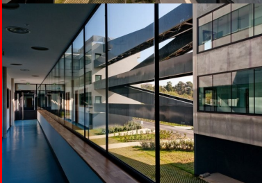
Le couloir entièrement vitré sur l'atrium.