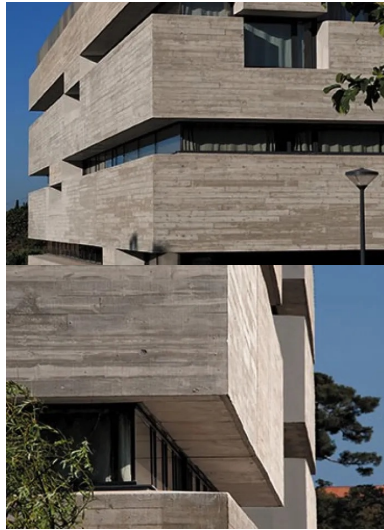
Les décalages d'éléments en béton animent le traitement horizontal des façades.