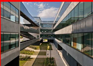
L'espace à ciel ouvert de l'atrium est un entre-deux protecteur, où la vie intérieure du bâtiment se révèle.

L'alternance des bandeaux de béton de 20 cm d'épaisseur et des bandeaux vitrés placés en retrait des façades périphériques semble se jouer des caractéristiques et du poids des matériaux : le verre semble supporter le béton. Leur réalisation a fait l'objet d'une attention particulière nécessitant un coulage du linteau et du voile en même temps, puis de l'allège. Un jeu de décrochages et d'encoches crée des ruptures dans l'horizontalité des façades. D'inspiration moderne, le bâtiment offre une qualité architecturale particulièrement remarquable dans ce secteur.