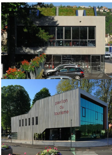
La toiture végétalisée se confond avec le paysage lointain.

Chaque année, un très grand nombre de visiteurs viennent découvrir la ville et ses alentours. Le nouveau pavillon du tourisme de Vienne et du Pays Viennois a pour vocation de les accueillir et de les informer tout en étant la vitrine de la ville et du territoire. Il se dresse au bord du Rhône à l'angle nord-ouest du parc du 8 mai 1945. Il est sculpté par son enveloppe en béton gris clair matricé, laissé brut de décoffrage , qui se découpe sur la végétation du parc. Sa matière et la vibration de sa texture animent la peau du bâtiment et accompagnent le porte-à-faux de l'étage, tendu vers le Rhône. Sur la façade nord, les lettres de l'enseigne « pavillon du tourisme » s'impriment en creux dans le béton. Enchâssées dans l'enveloppe minérale, trois parois en verre habillent la façade nord et les côtés ouverts sous le porte-à-faux. Le pavillon du tourisme offre ainsi à ses visiteurs un vaste linéaire vitré, ouvert sur l'espace urbain et sur le Rhône. « Par sa forme et son esprit, notre projet évoque un pavillon, soulevé du sol, qui expose sa terre, son terroir, ses racines, ses ressources et ses plaisirs. Au sens architectural, ce pavillon a la force d'une " folie ", objet inattendu, signal visible de toute part, qui interroge, suscite l'intérêt et la visite. Au sens imagé, ce pavillon est la chambre d'écho de l'office du tourisme, à l'écoute et au service des acteurs de son territoire », expliquent les architectes.