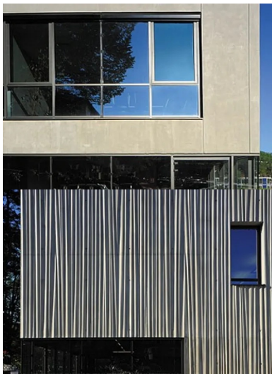
Le service de location de vélos, installé au rez-de-chaussée de la façade est, met les vélos en vitrine et incite à leur usage.

Le bâtiment, isolé par l'intérieur, répond aux exigences de la RT 2012. Un vide entre les éléments verticaux et horizontaux en béton est rempli avec l'isolant et assure la rupture de pont thermique. Seules les connexions nécessaires à la stabilité structurelle sont conservées.