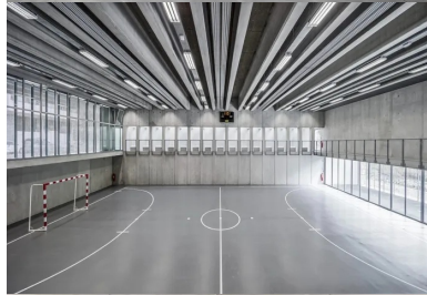
À l'intérieur, le bâtiment est rythmé par la trame de 1,80 m, sur laquelle est calé l'ensemble du bâtiment et notamment la succession de poutres précontraintes qui soutient la toiture.