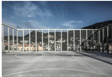
L'aire de jeu extérieure sur le toit est cadrée par un péristyle en béton d'une finesse surprenante. L'aire de jeu extérieure sur le toit est cadrée par un péristyle en béton d'une finesse surprenante.

On est bien à « l'Ariane » avec ses hauts immeubles et, cependant, ce point de vue surélevé produit une mutation du regard qui permet d'embrasser la totalité de la skyline et prouve que cette ville-là peut aussi être belle.