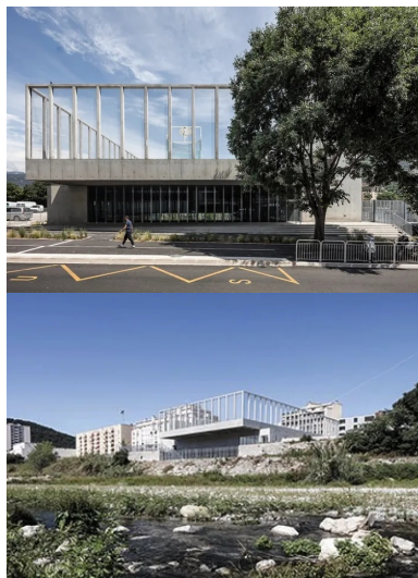
La salle s'implante au plus près du niveau du lit du fleuve. elle est ainsi semi-enterrée par rapport au niveau du boulevard.

À l'intérieur, l'organisation est particulièrement claire. La salle de futsal s'implante perpendiculairement au boulevard, on y accède en mezzanine et latéralement avec, d'un côté, les tribunes de 160 places assises, alors que de l'autre, se succèdent les différents bureaux des associations. L'accès au terrain de sport et aux vestiaires en contrebass est organisé en limite sud dans un noyau de circulations verticales. Celles-ci forment un ensemble monumental où l'on se voit entre les niveaux : en bas, les sportifs qui vont vers les vestiaires ; en haut, ceux qui vont sur le toit ; au centre, les locaux techniques, avec la sous-station et les centrales de traitement d'air.