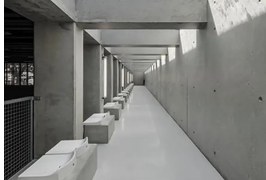
Éclairées naturellement par une verrière en toiture, les loges sont baignées de lumière.