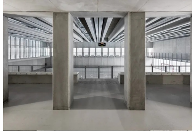
La monochromie du béton est apaisante et pérenne. Les tribunes surplombent la salle et ont une capacité de 160 places assises.