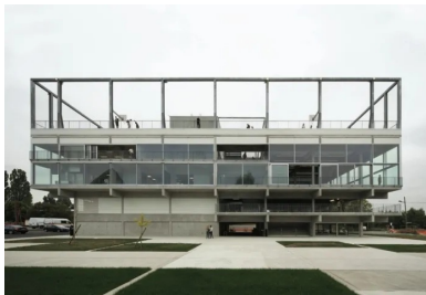
Pas de hiérarchisation des façades qui sont traitées selon le même principe.