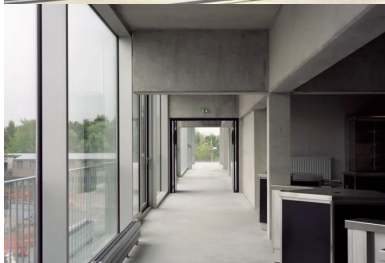
des vues et des perspectives sont ménagées jusque dans les espaces de circulation.

Reportage photos : Maxime DELVAUX et Muoto Architectes