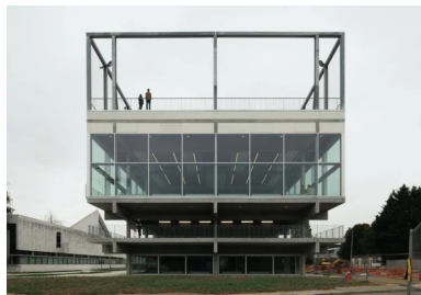
toutes les fonctions de l'équipement sont lisibles en façade.

L'édifice est couronné par une structure métallique qui rappelle celle du béton, dans son dessin comme dans sa teinte grise. Elle sert de support aux filets de protection des terrains de sport (basket, handball, football) et propulse le bâtiment vers le ciel, ce qui renforce encore l'impression de décollement et lui procure une monumentalité surprenante. Cinq trames de 6,90 m constituent la structure dans le sens est/ouest, et deux de 8,80 m dans le sens nord/sud. Les éléments du programme s'inscrivent strictement dans ce maillage, ce qui crée une rigueur dans le traitement des différents espaces.