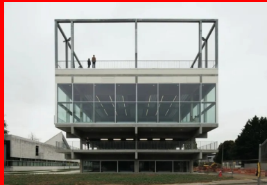
toutes les fonctions de l'équipement sont lisibles en façade.

L'édifice est couronné par une structure métallique qui rappelle celle du béton, dans son dessin comme dans sa teinte grise. Elle sert de support aux filets de protection des terrains de sport (basket, handball, football) et propulse le bâtiment vers le ciel, ce qui renforce encore l'impression de décollement et lui procure une monumentalité surprenante. Cinq trames de 6,90 m constituent la structure dans le sens est/ouest, et deux de 8,80 m dans le sens nord/sud. Les éléments du programme s'inscrivent strictement dans ce maillage, ce qui crée une rigueur dans le traitement des différents espaces.