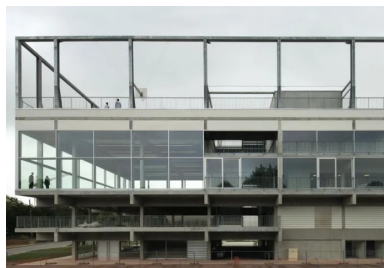
Le bâtiment est conçu comme un empilement, sa structure est partout apparente.

Au-dessus, le restaurant universitaire s'élève sur une double hauteur et occupe la moitié est de la surface. « Nous avons souhaité offrir aux usagers des espaces généreux, qui créent des perspectives, permettent d'autres usages (expositions, concerts...), et en même temps engendrent des contrastes. Certains espaces sont pincés - la cafétéria ou la mezzanine - alors que d'autres s'ouvrent sur l'horizon, comme le restaurant universitaire entièrement vitré, d'où l'on peut embrasser d'un regard tout le paysage du plateau », explique Gilles Delalex. L'autre extrémité abrite, sur deux niveaux, le self et la cuisine, et au-dessus deux salles de sport. Le noyau central est occupé par de vastes espaces de circulation ouverts et les ascenseurs.