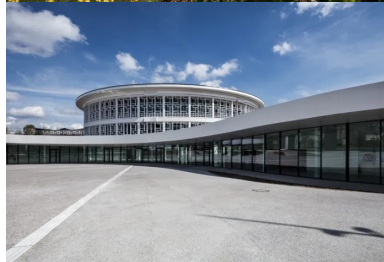
La façade largement vitrée de l'extension rend visible de l'extérieur ce qui se passe dans le bâtiment et invite à entrer.