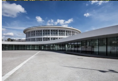
La façade largement vitrée de l'extension rend visible de l'extérieur ce qui se passe dans le bâtiment et invite à entrer.