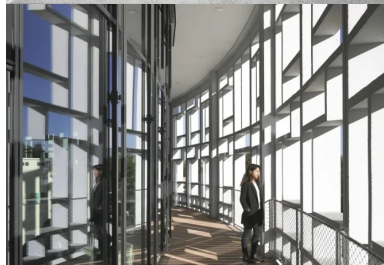
La peau vitrée placée en retrait des claustras engendre aux premier et second étages une coursive circulaire.