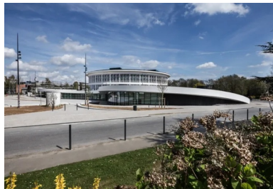
L'acrotère blanc en béton dessine un renforcement qui libère au sol un vaste parvis.

Le bâtiment d'origine a fait l'objet d'une réorganisation et d'une rénovation complète. La coupole en pavés de verre, qui dominait le cœur de l'édifice, est remplacée par une verrière contemporaine lumineuse, disposée à un niveau plus élevé. Elle éclaire ainsi un espace formant un atrium intérieur généreux, véritable foyer spatial de Lilliad. L'ondulation de l'extension, soulignée par son acrotère blanc en béton, dessine un renforcement qui libère au sol un vaste parvis. L'espace culturel et la maison des étudiants. L'entrée du Learning Center Innovation donne sur le parvis. La façade largement vitrée de l'extension rend visible de l'extérieur ce qui se passe dans le bâtiment et invite à entrer.