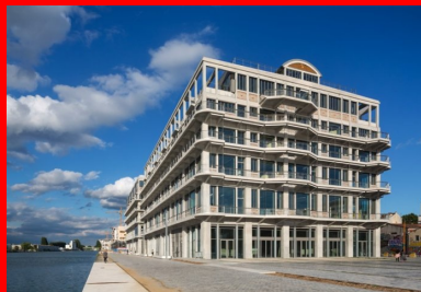
1 400 m de coursives ceinturent l'imposante structure sur ses quatre faces.

La lumière naturelle pénètre dans l'épaisseur du bâtiment par les façades extérieures, mais aussi par les puits de lumière du patio planté créé dans les niveaux supérieurs. Celui-ci a impliqué la déconstruction de près de 4 000 m 2 de surface de plancher. Porté grâce à la relation de confiance qui lie BETC et Jung Architectures depuis quinze ans, ce « sacrifice » a permis la création d'espaces ouverts et lumineux où tout est fait pour encourager les rencontres spontanées. Ainsi, derrière des façades intérieures en mêlée, de multiples espaces permettent aux occupants de travailler ensemble dans l'environnement qu'ils souhaitent en multipliant les circulations et les points de convergence. Enfin, le cinquième étage a été en partie démantelé pour accueillir un jardin en pleine terre. Tout en assurant des refuges pour les insectes et les oiseaux, les poutres de structure forment aujourd'hui une immense pergola sous laquelle il fait bon travailler ou se détendre.