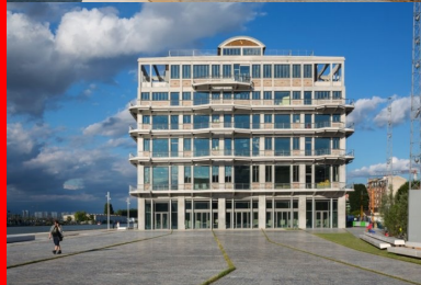
des places et une promenade agrémentées de jardins accompagnent le bâtiment.