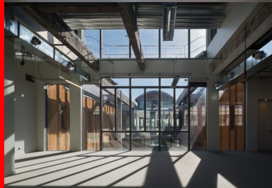
Au cœur de l'édifice, un patio triple hauteur, créé par la suppression de 4 000 m 2 de planchers, assure une réponse environnementale en termes de ventilation, de rafraîchissement, de désenfumage et de lumière naturelle.