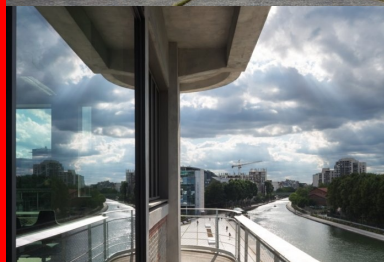
Des vues sur le grand Paris à tous les étages.