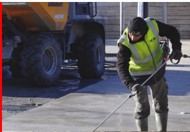
L'une des dernières parcelles de béton du parvis, en cours de désactivation au nettoyeur haute pression.