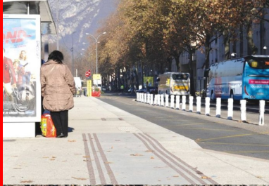
Des bandes rugueuses de couleur grenat, créées sur le béton désactivé, signalent la présence de voies cyclables.