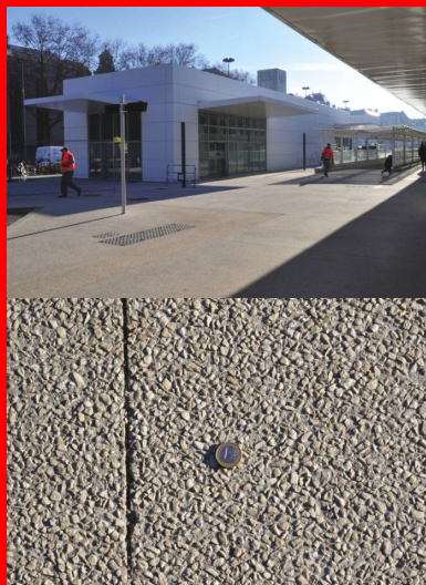
La gare routière est située dans le prolongement du terminal ferroviaire.

La nouvelle gare SNCF de Grenoble a été inaugurée début février 2017, après trente-deux mois de travaux. Le complexe comprend également une gare routière, une station de taxis et une Maison du vélo. Point d'orgue de cette opération, unanimement saluée pour son esthétique et sa modernité : le parvis, entièrement réalisé en béton désactivé.