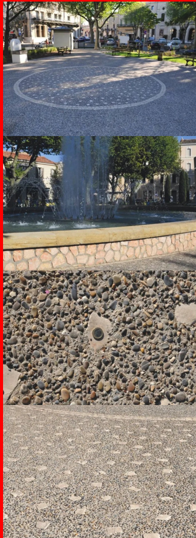
Le béton désactivé avec granulats roulés de Durance, cloutés de petits pavés calcaires, a métamorphosé le square Charles-de-Gaulle.