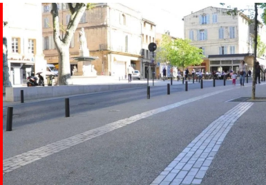
Les cours ont reçu un revêtement de béton désactivé avec des cailloux concassés clairs et un calépinage de bandes structurantes en pierres calcaires naturelles Cénia.