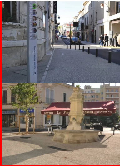
Le béton drainant, une solution efficace contre l'« inondabilité chronique ».