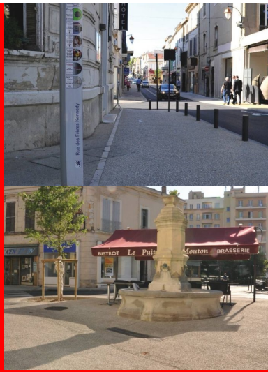
Le béton drainant, une solution efficace contre l'« inondabilité chronique ».