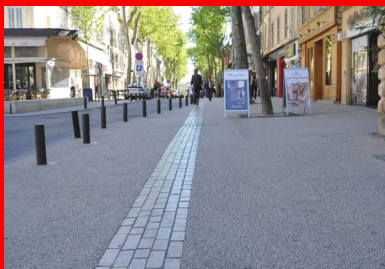
Le calepinage des bandes structurantes en pierre Cénia rythme les différents espaces (terrasses de café, fontaines) et les trottoirs qui ont été élargis.

C'est là que tout a commencé... Ambition : redonner aux avenues principales du centre-ville une unité esthétique perdue au fil des décennies. C'est ce qui a guidé la Ville, au milieu des années 2000, dans le choix du béton désactivé . Rajeunis, tout en restant parfaitement dans la tradition, ces fameux « cours » provençaux ont accueilli deux bétons désactivés différents, avec des cailloux concassés calcaires clairs (carrière de Châteauneuf-les-Martigues, dans les Bouches-du-Rhône) et un calepinage très esthétique de bandes structurantes en pierres calcaires naturelles Cénia. Ces avenues séculaires méritaient mieux que le patchwork de revêtements qu'elles portaient à l'époque. Sans parler des problèmes de planimétrie, de stationnement, de circulation.