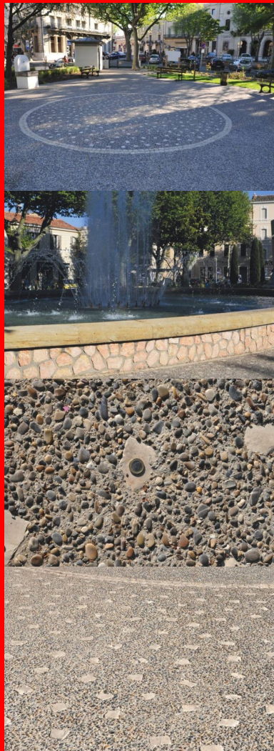
Le béton désactivé avec granulats roulés de Durance, cloutés de petits pavés calcaires, a métamorphosé le square Charles-de-Gaulle.