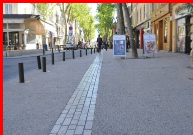
Le calepinage des bandes structurantes en pierre Cénia rythme les différents espaces (terrasses de café, fontaines) et les trottoirs qui ont été élargis.

C'est là que tout a commencé... Ambition : redonner aux avenues principales du centre-ville une unité esthétique perdue au fil des décennies. C'est ce qui a guidé la Ville, au milieu des années 2000, dans le choix du béton désactivé. Rajeunis, tout en restant parfaitement dans la tradition, ces fameux « cours » provençaux ont accueilli deux bétons désactivés différents, avec des cailloux concassés calcaires clairs (carrière de Châteauneuf-les-Martigues, dans les Bouches-du-Rhône) et un calepinage très esthétique de bandes structurantes en pierres calcaires naturelles Cénia. Ces avenues séculaires méritaient mieux que le patchwork de revêtements qu'elles portaient à l'époque. Sans parler des problèmes de planimétrie, de stationnement, de circulation.