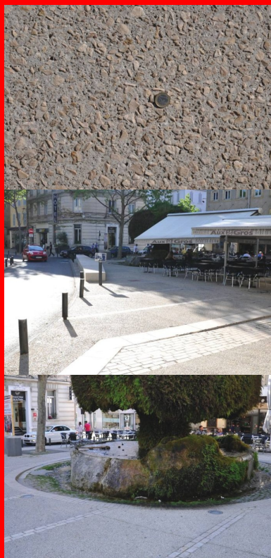
Les cailloux utilisés dans les bétons décoratifs proviennent de la carrière de Châteauneuf-les-Martigues (Bouches-du-Rhône), située à 50 km.

Le marché (dit « de définition ») lancé à l'origine a très vite montré « qu'il fallait envisager le problème de façon beaucoup plus large pour rester cohérent et englober dans cette réflexion les cours du centre-ville, vitaux pour l'activité économique, car ils accueillent de nombreux commerces », expliquaient à l'époque les responsables des services techniques (cf. Routes n° 98, décembre 2006, pp. 18-19). Problème important : l'absence de réseau d'eaux pluviales posant de « sérieux soucis en matière d'hygiène publique ». À la moindre intempérie, tout se déversait dans le canal de Craponne, un ouvrage datant de la Renaissance et destiné à irriguer la plaine environnante de la Crau. En prime, il existait encore d'anciennes canalisations en plomb, posant des problèmes en matière d'assainissement et d'eau potable.