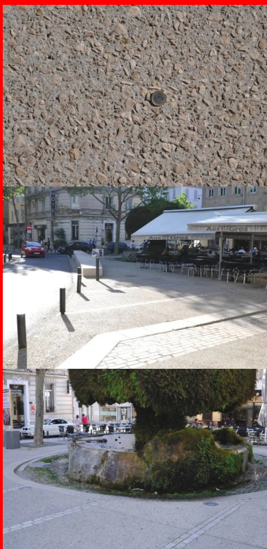
Les cailloux utilisés dans les bétons décoratifs proviennent de la carrière de Châteauneuf-les-Martigues (Bouches-du-Rhône), située à 50 km.

Le marché (dit « de définition ») lancé à l'origine a très vite montré « qu'il fallait envisager le problème de façon beaucoup plus large pour rester cohérent et englober dans cette réflexion les cours du centre-ville, vitaux pour l'activité économique, car ils accueillent de nombreux commerces », expliquaient à l'époque les responsables des services techniques (cf. Routes n° 98, décembre 2006, pp. 18-19). Problème important : l'absence de réseau d'eaux pluviales posant de « sérieux soucis en matière d'hygiène publique ». À la moindre intempérie, tout se déversait dans le canal de Craonne, un ouvrage datant de la Renaissance et destiné à irriguer la plaine environnante de la Crau. En prime, il existait encore d'anciennes canalisations en plomb, posant des problèmes en matière d'assainissement et d'eau potable.