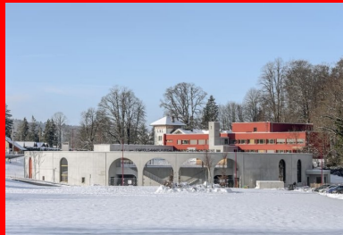
À travers les grandes arches cintrées qui marquent l'entrée se devine l'intérieur de l'école. Au second plan, le bâtiment réhabilité repeint en rouge.

Lové dans une dépression du terrain, le cercle scolaire La Franche-Montagne s'inscrit profondément dans le sol, au sens physique du terme. Il marque une entrée de la ville, par son architecture singulière - un bâtiment circulaire, en anneau, contenu dans de hauts voiles de béton -, ajoutant une dimension ludique à l'expression de son statut d'équipement public à vocation pédagogique et protectrice. Il remplace l'ancienne école du centre-ville de cette petite commune de moyenne montagne du massif du Jura située à une dizaine de kilomètres de la frontière franco-suisse, dont la capacité d'accueil est devenue insuffisante, difficile à étendre et à mettre aux normes.