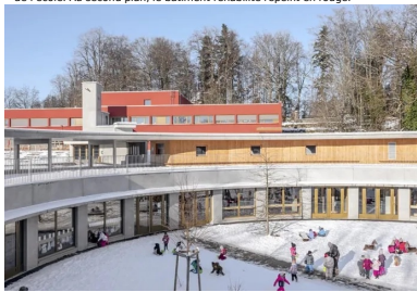
La cour des maternelles occupe tout l'espace central du cercle.