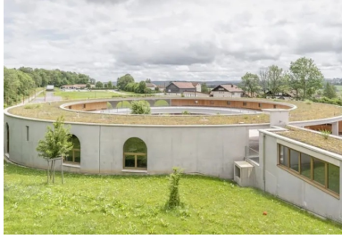
Encastrée dans le talus, l'extension ceinte par des murs de béton brut, sobres. La toiture végétalisée contribue à son insertion paysagère.

Avec son enceinte de béton brut, le cercle scolaire La Franche-Montagne conçu par les architectes de BQ+A se coule dans la topographie du site.