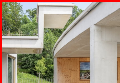
À l'étage, le passage protégé vers l'école élémentaire avec sa casquette anguleuse qui laisse filer la courbe de la toiture.

Précédé d'une « langue » de parking paysager associé à deux noues pour infiltrer les eaux de pluie à la parcelle et bordé par un champ, le bâtiment se déploie à partir d'une doline, une excavation circulaire généralement fermée, à fond plus ou moins plat. De plan circulaire, l'extension y est calée de manière à préserver la vue du bâtiment existant situé en partie haute du terrain, créant un étagement depuis l'entrée, avec la cour haute et la toiture plantée qui atténue l'effet de hauteur de ses murs courbes de 8 m.