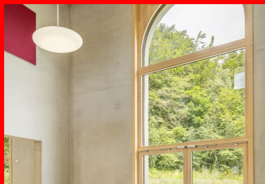
Le béton brut des murs et du plafond, associé à des éléments en bois et à la lumière naturelle qui pénètre par la grande fenêtre, l'imposte vitrée placée dans la double hauteur et la circulation qualifient le volume des salles.