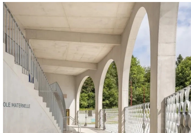
À partir du porche d'entrée, les escaliers mènent directement à la cour haute.