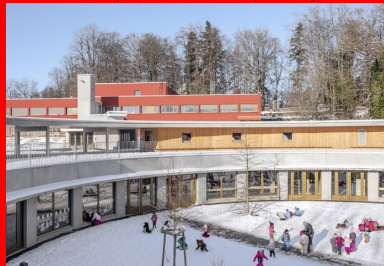
La cour des maternelles occupe tout l'espace central du cercle.