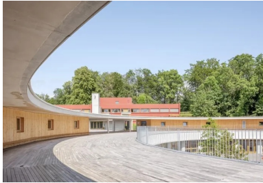
La cour des élémentaires, aménagée sur la toiture intermédiaire.