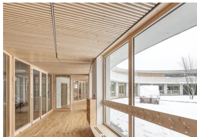
Circulation vitrée qui borde d'un côté la cour des maternelles, de l'autre les salles qu'elle distribue.

Réhabilité et réaménagé pour accueillir les classes d'élémentaire, le bâtiment existant construit dans les années 1970 fonctionne avec le nouveau bâtiment où se trouvent, en plus des salles de classe de maternelle, toutes les salles communes au groupe scolaire comme le réfectoire, la bibliothèque et la salle polyvalente ainsi que l'accueil périscolaire. Visibles depuis le parvis de l'entrée commune traitée en porche avec ses arcades hautes, la cour des maternelles occupe le centre du cercle à rez-de-chaussée et, au-dessus, la cour haute en anneau et en balcon est celle des élèves d'élémentaire. Sans être mélangés, les élèves gardent un contact visuel et, sans doute, sonore. La cour haute, aménagée sur la toiture intermédiaire, est en partie protégée du soleil et de la pluie sur sa périphérie par le débord de la toiture en béton . Le bois du sol et des murs confère une intimité à cet espace à ciel ouvert atypique où les enfants s'ébattent ou se posent et parfois, usage imprévu, l'utilisent en vélodrome.