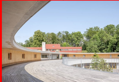
La cour des élémentaires, aménagée sur la toiture intermédiaire.