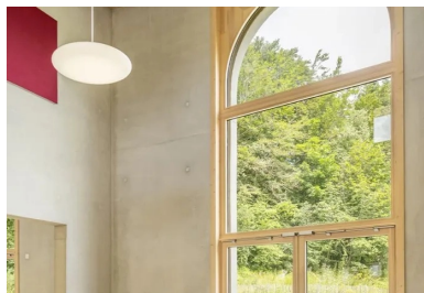
Le béton brut des murs et du plafond, associé à des éléments en bois et à la lumière naturelle qui pénètre par la grande fenêtre, l'imposte vitrée placée dans la double hauteur et la circulation qualifient le volume des salles.