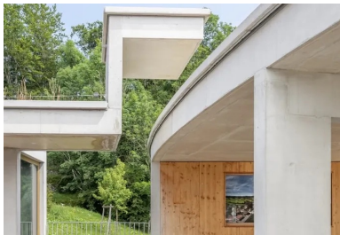
À l'étage, le passage protégé vers l'école élémentaire avec sa casquette anguleuse qui laisse filer la courbe de la toiture.

Précédé d'une « langue » de parking paysager associé à deux noues pour infiltrer les eaux de pluie à la parcelle et bordé par un champ, le bâtiment se déploie à partir d'une doline, une excavation circulaire généralement fermée, à fond plus ou moins plat. De plan circulaire, l'extension y est calée de manière à préserver la vue du bâtiment existant situé en partie haute du terrain, créant un étage depuis l'entrée, avec la cour haute et la toiture plantée qui atténue l'effet de hauteur de ses murs courbes de 8 m.