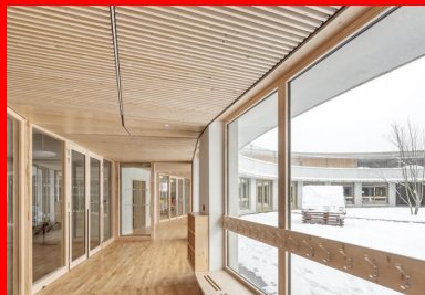
Circulation vitrée qui borde d'un côté la cour des maternelles, de l'autre les salles qu'elle distribue.

Réhabilité et réaménagé pour accueillir les classes d'élémentaire, le bâtiment existant construit dans les années 1970 fonctionne avec le nouveau bâtiment où se trouvent, en plus des salles de classe de maternelle, toutes les salles communes au groupe scolaire comme le réfectoire, la bibliothèque et la salle polyvalente ainsi que l'accueil périscolaire. Visibles depuis le parvis de l'entrée commune traitée en porche avec ses arcades hautes, la cour des maternelles occupe le centre du cercle à rez-de-chaussée et, au-dessus, la cour haute en anneau et en balcon est celle des élèves d'élémentaire. Sans être mélangés, les élèves gardent un contact visuel et, sans doute, sonore. La cour haute, aménagée sur la toiture intermédiaire, est en partie protégée du soleil et de la pluie sur sa périphérie par le débord de la toiture en béton. Le bois du sol et des murs confère une intériorité à cet espace à ciel ouvert atypique où les enfants s'ébattent ou se posent et parfois, usage imprévu, l'utilisent en vélodrome.