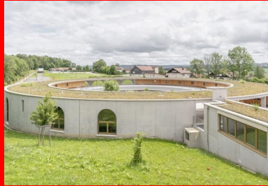
Encastrée dans le talus, l'extension ceinte par des murs de béton brut, sobres. La toiture végétalisée contribue à son insertion paysagère.

Avec son enceinte de béton brut , le cercle scolaire La Franche-Montagne conçu par les architectes de BQ+A se coule dans la topographie du site.