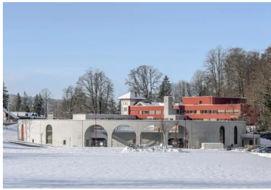
À travers les grandes arches cintrées qui marquent l'entrée se devine l'intérieur de l'école. Au second plan, le bâtiment réhabilité repeint en rouge.

Lové dans une dépression du terrain, le cercle scolaire La Franche-Montagne s'inscrit profondément dans le sol, au sens physique du terme. Il marque une entrée de la ville, par son architecture singulière – un bâtiment circulaire, en anneau, contenu dans de hauts voiles de béton –, ajoutant une dimension ludique à l'expression de son statut d'équipement public à vocation pédagogique et protectrice. Il remplace l'ancienne école du centre-ville de cette petite commune de moyenne montagne du massif du Jura située à une dizaine de kilomètres de la frontière franco-suisse, dont la capacité d'accueil est devenue insuffisante, difficile à étendre et à mettre aux normes.