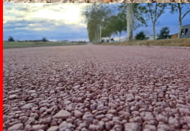
Piste cyclable en BCR poreux coloré rouge, à Pibrac (31).