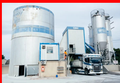
Centrale discontinue de type BPE, où le BCR est étudié et fabriqué.