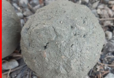
La consistance optimale du BCR, succès de « l'essai à la boule » pour un BCR poreux et pour un BCR de surface.