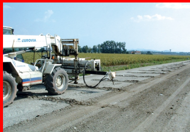
Réalisation de la préfissuration à l'aide de la machine Olivia®.

NOTA : le cas échéant, une couche granulaire de 8 cm d'épaisseur peut jouer le rôle d'une couche anti-remontée de fissures, mais à condition d'accepter son rôle de couche de séparation.