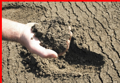
Le matériau BCR est constitué de granulats, de liant hydraulique (ciment ou LHR), d'eau et éventuellement d'adjuvants.

Les adjuvants plastifiants/réducteurs d'eau peuvent également être utilisés pour :