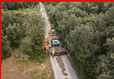
Réfection d'une piste cyclable : mise en œuvre au frotteur d'un BCR bas carbone intégrant 100 % de granulats recyclés.