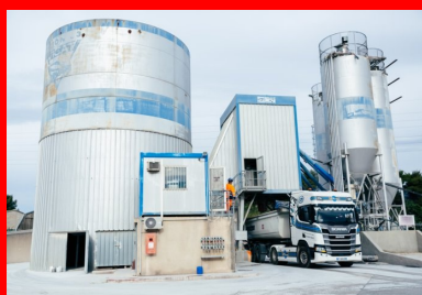
Centrale discontinue de type BPE, où le BCR est étudié et fabriqué.