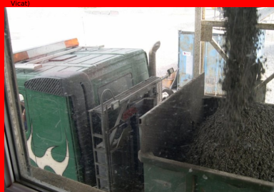
Le BCR peut être fabriqué dans une centrale continue de type grave traitée.