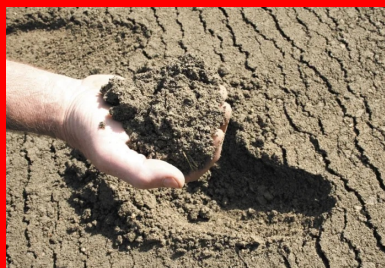
Le matériau BCR est constitué de granulats, de liant hydraulique (ciment ou LHR), d'eau et éventuellement d'adjuvants.

Les adjuvants plastifiants/réducteurs d'eau peuvent également être utilisés pour :