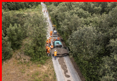
Réfection d'une piste cyclable : mise en œuvre au frotteur d'un BCR bas carbone intégrant 100 % de granulats recyclés.