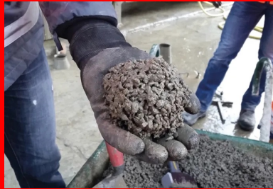
La consistance optimale du BCR, succès de « l'essai à la boule » pour un BCR poreux et pour un BCR de surface.

Cette application particulière du BCR en couche de roulement, bien que très développée à l'international, ne fait pas encore l'objet d'un référencement normatif en France et n'est donc pas couverte par la norme NF P 98-128.