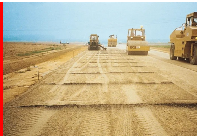
Atelier de compactage du BCR, constitué de rouleaux vibrants suivis d'un compacteur à pneus.