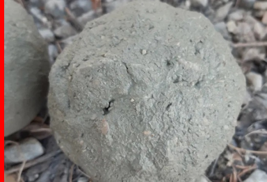
La consistance optimale du BCR, succès de « l'essai à la boule » pour un BCR poreux et pour un BCR de surface.