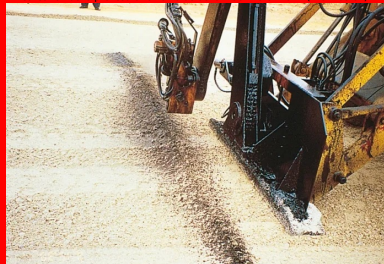
Réalisation de la préfissuration à l'aide de la machine Craft Emulsion®.