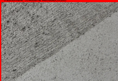
Le BCR reçoit ensuite le traitement de surface prévu : ici, une finition balayée traditionnelle.