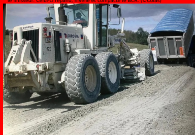
Un camion-benne, bâché durant le transport du BCR, déverse le matériau devant la niveleuse. Celle-ci répand et nivelle le BCR.