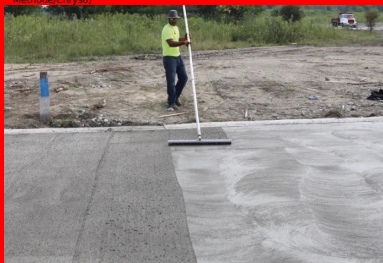
Le BCR reçoit ensuite le traitement de surface prévu : ici, une finition balayée traditionnelle.