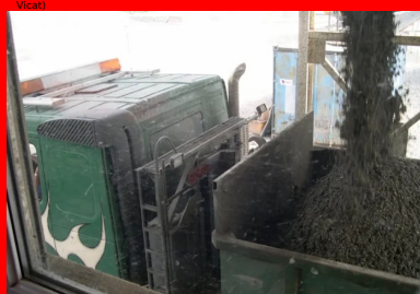
Le BCR peut être fabriqué dans une centrale continue de type grave traitée.