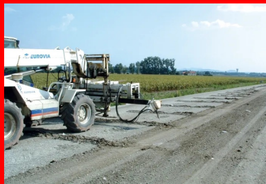
Réalisation de la préfissuration à l'aide de la machine Olivia®.

NOTA : le cas échéant, une couche granulaire de 8 cm d'épaisseur peut jouer le rôle d'une couche anti-remontée de fissures, mais à condition d'accepter son rôle de couche de séparation.