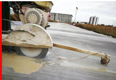
Sciage de joint sur chaussée en BCR.