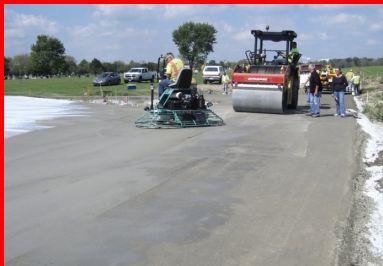
L'adjuvant spécial au BCR s'applique sur la surface juste avant le passage de la truelle mécanique, avec un pulvérisateur à grand débit. Il permet au béton d'être taloché fin, avec suffisamment de pâte cimentaire en surface.