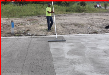
Le BCR reçoit ensuite le traitement de surface prévu : ici, une finition balayée traditionnelle.