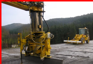
Réalisation de la préfissuration avec le procédé Joints Actifs®.

Les règles à appliquer et les précautions à prendre pour limiter la fissuration des BCR sont contenues dans :