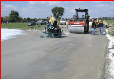
L'adjuvant spécial au BCR s'applique sur la surface juste avant le passage de la truelle mécanique, avec un pulvérisateur à grand débit. Il permet au béton d'être taloché fin, avec suffisamment de pâte cimentaire en surface.