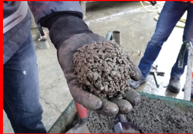
La consistance optimale du BCR, succès de « l'essai à la boule » pour un BCR poreux et pour un BCR de surface.

Cette application particulière du BCR en couche de roulement, bien que très développée à l'international, ne fait pas encore l'objet d'un référencement normatif en France et n'est donc pas couverte par la norme NF P 98-128.