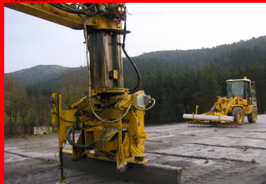
Réalisation de la préfissuration avec le procédé Joints Actifs®.

Les règles à appliquer et les précautions à prendre pour limiter la fissuration des BCR sont contenues dans :