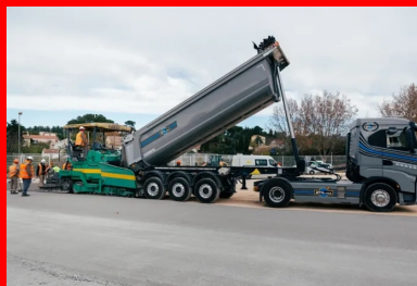
Un camion-benne, bâché durant le transport du BCR, déverse le matériau dans le finisseur. Celui-ci répand, nivelle et compacte le BCR.