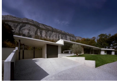
Dès l'entrée, la maison séduit par ses lignes tendues et la variété des surfaces en béton.

Le défi consistant à bâtir une maison d'habitation face à un paysage montagneux a été relevé par une conception délicate et respectueuse du site. Dans ce projet, le béton s'exprime par ses diverses surfaces et son caractère minéral.