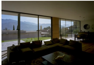
Sous un plafond blanc uniforme, le salon et la salle à manger jouissent d'une vue imprenable à peine interrompue par des menuiseries métalliques filigranes.

Quant aux murets du jardin assurant une certaine intimité visuelle, ils sont en béton architectonique et présentent des ressauts à l'instar du débord de toiture. Les accès piétons, sous la forme de pas d'âne, ainsi que l'emmarchement menant à la terrasse, sont en béton quartz surfacé à l'hélicoptère. Le sol de la loggia présente des joints de recoupement définissant des zones de 25 m 2 pour empêcher la formation de fissures. Cette diversité de surfaces en béton engendre une harmonie visuelle avec une palette chromatique froide rappelant l'environnement montagneux.