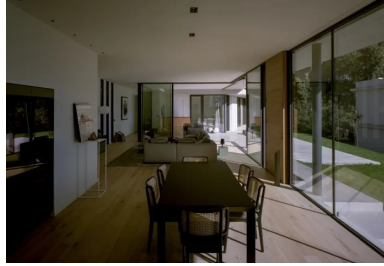
Dans l'espace à vivre, la porte en bois et le parquet marquent un contraste avec les emmarchements et le débord de toiture en béton.

et le débord de toiture. Ces surfaces, ainsi que la sous-face de l'auvent, sont en béton architectonique obtenu par coulage entre des banches métalliques dont témoignent les trous d'étrésillons. À l'intérieur, seuls le garage et le bloc technique des pièces d'eau sont en béton apparent. Ce caractère apparent se retrouve dans les différents revêtements de sol. On pense notamment à la rampe d'accès pour véhicules en béton désactivé dont les agrégats concassés et les couleurs ont été choisis.