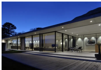
En soirée, l'éclairage artificiel met en valeur l'intérieur devancé par la loggia et le platelage en bois de la terrasse. Le béton n'est dès lors plus visible qu'au sol.

Avec son porte-à-faux d'un mètre, le débord de toiture exerce une fonction esthétique majeure consistant à éviter un acrotère d'une soixantaine de centimètres de hauteur. Celui-ci se présente sous la forme d'une poutre acrotère avec son relevé d'étanchéité, à l'aplomb de la façade vitrée. Le débord assure aussi une protection solaire partielle, notamment contre les rayons du soleil très verticaux les jours d'été. Cette protection est complétée par une série de brise-soleil orientables, objets d'une étude technique poussée, en partie haute de la façade vitrée. Il s'agissait en effet de les loger dans un caisson, avec les différents réseaux techniques, au nu du faux-plafond suspendu en plaques de plâtre. Ce détail est essentiel car il participe d'un autre double objectif : la discrétion et l'optimisation des surfaces vitrées.