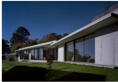
La façade principale se caractérise par l'articulation des volumes et le contraste entre généreuses surfaces vitrées et béton banché.

Conçue par l'architecte grenoblois Guy Depollier pour une famille de quatre personnes, la maison particulière à Meylan, en Isère, est implantée sur une longue parcelle face au splendide massif de Belledonne. Exposée au sud, sa volumétrie étirée et coudée s'explique par les limites parcellaires et les courbes altimétriques du terrain. La maison étant longée par un chemin à l'arrière, côté nord, elle oppose une longue paroi aveugle. Par contraste, la façade sud face au majestueux paysage alpin fait la part belle aux surfaces vitrées, à peine masquées par trois poteaux métalliques élancés de 16 cm de diamètre.