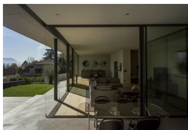
En hommage au paysage, l'angle vitré s'efface et autorise des vues panoramiques depuis la loggia.

La façade sud est constituée de vitrages coulissants autoporteurs sur rail. Les dormants des menuiseries à ouvrant caché en aluminium laqué - d'une dizaine de centimètres de hauteur - sont dissimulés dans le sol et en plafond. Quant aux montants, ils ne dépassent pas 2 cm en largeur, libérant ainsi la vue sur le panorama. Enfin, le coulissement des parties vitrées permet une dissolution visuelle de l'angle : la grande salle à vivre fusionne dès lors avec la loggia et l'extérieur. Avec son imposte en chêne et son bâton de maréchal, la porte d'entrée ponctue cette façade vitrée tout en rappelant le bois en ipé du platelage de la terrasse extérieure souhaitée par le client.