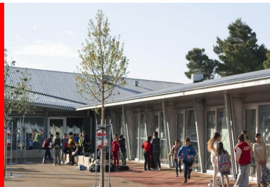
Protégée par l'organisation du bâti, la cour devient le prolongement physique des salles de classe.