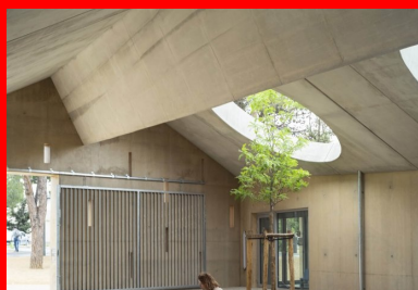
Le lieu d'attente des parents bénéficie de toute la hauteur du volume sous rampart. L'espace est ainsi protégé mais largement ouvert sur le parvis.

« Il s'agit d'un bâtiment bipolaire », explique l'architecte Gaël Le Nouène, l'un des fondateurs d'ateliers o-s. « Il y a cet anneau épais et minéral qui remplit ses fonctions défensives et de durabilité, où le béton est cohérent dans son rapport au sol et son aspect sablé couleur terre. À l'intérieur, une structure métallique a été privilégiée pour des raisons de réversibilité, d'évolutivité et de rationalité du plan. »