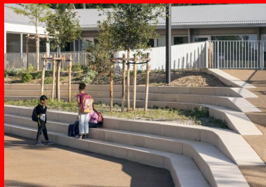
Un aménagement en gradins qui permet de gérer la pente naturelle du terrain anime la cour.

Dans ce cœur, c'est un bâtiment-paysage qui se dévoile, à travers la géométrie de ses facettes et des plis des toitures en bac acier ondulé, avec ses gradins, ses aires de jeu et ses jardins pédagogiques.