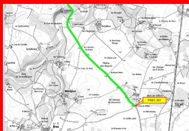
Figure 2. Les travaux de calibrage et de renforcement de la RD7, en 2022, ont concerné la section comprise entre le carrefour RD7-RD25 et l'ouvrage d'art franchissant la Bouleure.

Fort du succès de cette première réalisation, et en raison de l'intérêt économique et environnemental de la solution de retraitement, le département de la Vienne a donc décidé de poursuivre vers le nord le recalibrage et le renforcement de cette section sur la commune de Brux, soit depuis le carrefour avec la RD25 jusqu'à l'ouvrage d'art franchissant la Bouleure, sur une longueur de 3 660 m. L'objectif était d'élargir la chaussée (de 5,40 à 6 m) pour assurer la sécurité de tous les usagers et supporter le trafic quotidien. Les travaux s'élevaient à 800 000 € et ont été financés par le département de la Vienne.