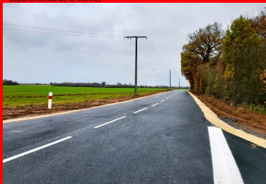
Le tronçon rénové de la RD7 a reçu un nouveau tapis d'enrobés (EB10 sur 6 cm d'épaisseur), avant d'être rouvert à la circulation le 16 décembre 2022.