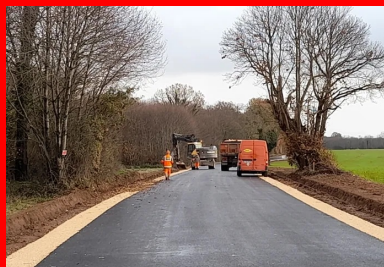
Réalisation des fossés latéraux, (© Ludovic Padeloup/Conseil départemental de la Vienne)

Les livraisons du liant se sont concentrées sur la semaine 46 (plus précisément du 15 au 22 novembre 2022). Cela a nécessité la mise en place d'une organisation et d'une logistique appropriées, permettant de livrer des quantités importantes de liant (800 t) sur une période relativement courte. « Nous nous sommes ajustés aux contraintes de l'entreprise, notamment au démarrage, afin de les accompagner dans la réalisation qualitative de ce chantier », ajoute Wilfrid Beck.