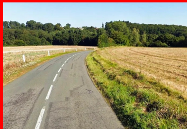
Etat de la chaussée de la RD7 sur la commune de Brux, avant les travaux de réhabilitation.

Comme cette nouvelle section présentait les mêmes caractéristiques géotechniques que celle de 2018, réalisée sur la commune de Blanzay, le conseil départemental a décidé de la traiter avec la même technique (le diagnostic et l'étude géotechnique ayant été réalisés lors de la première section de travaux).