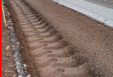
Malaxage du matériau de l'ancienne chaussée avec le liant Ligex M10 sur une profondeur de 35 cm, permettant d'obtenir un matériau homogène sur toute l'épaisseur et sur toute la largeur de la nouvelle chaussée.

Après un premier chantier lancé en 2018 sur la RD7, entre Blanzay et Brux, le conseil départemental de la Vienne a récidivé en 2022 avec un chantier de retraitement de chaussée en place au liant hydraulique routier sur la RD7, à Brux. Celui-ci a été réalisé par Colas en faisant appel au liant hydraulique routier Ligex M10, fabriqué et fourni par Heidelberg Materials. Cette solution sans évacuation de matériaux a permis de répondre au cahier des charges (élargissement de la route, renforcement et homogénéisation de sa structure), en valorisant le patrimoine routier du site tout en réduisant les impacts sur l'environnement.