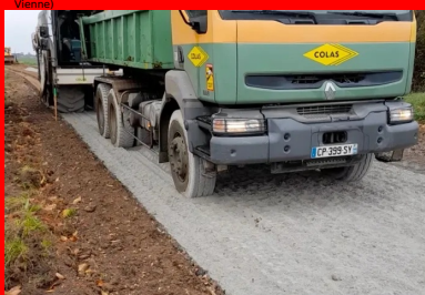
Malaxage du matériau de l'ancienne chaussée avec le liant Ligex M10 sur une profondeur de 35 cm à l'aide d'un pulviseur moderne Wirtgen WR240, permettant d'obtenir un matériau homogène sur toute l'épaisseur et sur toute la largeur de la nouvelle chaussée.