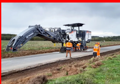
Fragmentation de l'ancienne chaussée sur 15 cm et régalaé du matériau décohesionné sur toute la largeur de la nouvelle plate-forme de chaussée.

« À cette fin, une raboteuse a servi au fraisage de la chaussée, complétée d'un ripper afin de garantir une répartition homogène et uniforme des granulats issus de la fragmentation. Le chantier n'a généré aucun déchet . Les teneurs en eau ont été mesurées lors de cette opération. L' apport d'eau afin d'obtenir la teneur en eau de l' optimum Proctor Modifié a été effectué lors de l'opération de malaxage par injection directe de l'eau dans la cloche du malaxeur », précise Gaëtan Bossé, conducteur de travaux à l'agence Colas de Châtellerault.