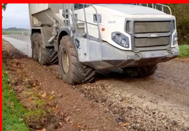
Épandage du liant Ligex M10 à raison de 35 kg/m 2 (dosage 5%) à l'aide d'un épandeur moderne doté d'un système de dosage volumétrique asservi à la vitesse d'avancement.

Le liant a été ainsi épandu uniformément sur toute la surface de la voie, selon un débit proportionnel à l'avancement de l'épandeur pour respecter le dosage de 5%. L'uniformité de l'épandage a été vérifiée par des tests « à la bêche ». Plusieurs porteurs se sont succédé pour délivrer au total 850 t de liant.