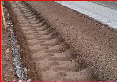
Malaxage du matériau de l'ancienne chaussée avec le liant Ligex M10 sur une profondeur de 35 cm à l'aide d'un pulvimixeur moderne Wirtgen WR240, permettant d'obtenir un matériau homogène sur toute l'épaisseur et sur toute la largeur de la nouvelle chaussée.