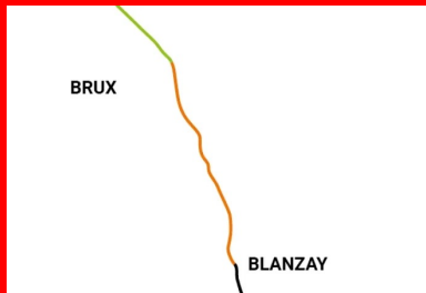
Figure 1. La RD7 traverse, dans sa partie sud, les communes de Civray, de Blanzay, de Brux et de Valence-en-Poitou.

Au milieu d'exploitations agricoles et de production de bois (bois d'œuvre, bois énergie), la commune de Brux, d'environ 760 habitants, a su conserver son caractère rural. En outre, la commune est traversée par la Bouleure, affluent de la Dive du Sud, sur 8 km. C'est une rivière temporaire, qui devient permanente quelques kilomètres en aval, sur la commune de Vaux (Vienne).