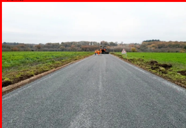
Mise en œuvre de la couche de surface en EB10.