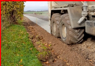
Épandage du liant Ligex M10 à raison de 35 kg/m 2 (dosage 5%) à l'aide d'un épandeur moderne doté d'un système de dosage volumétrique asservi à la vitesse d'avancement.