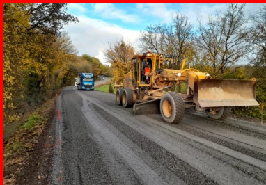
Mise en œuvre de la couche anti-remontée de fissures en grave non traitée sur une épaisseur de 8 cm.

Au l'issue de la période de prise et de séchage, une couche anti-remontée de fissures en GNT 0/20 a été mise en place sur une épaisseur de 8 cm ( \pm 2 cm) et sur une largeur de 6,50 m. Elle a été protégée avec un enduit superficiel.