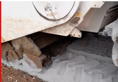
Malaxage du matériau de l'ancienne chaussée avec le liant Ligex M10 sur une profondeur de 35 cm à l'aide d'un pulvimixeur moderne Wirtgen WR240, permettant d'obtenir un matériau homogène sur toute l'épaisseur et sur toute la largeur de la nouvelle chaussée.